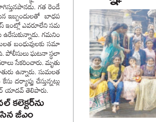
విజ్ఞాన యాత్రకు వెళ్ళిన విద్యార్థులు

మంథని, జనవరి 9: పట్టణంలోని కృష్ణవేణి పాఠశాల విద్యార్థులు మంగళవారం విజ్ఞాన యాత్రకు బయలుదేరారు. చదువుతో పాటు సంస్కృతి, సంప్రదాయాలు, మహనీయుల చరిత్రలను తెలియజేసే కార్యక్రమంలో పాల్గొంటున్న విద్యార్థులకు ప్రాథమికంగా ఉన్న మొదటి ప్రాథమిక విజ్ఞాన యాత్ర, రుద్రమదవికోట తదితర ప్రాంతాలకు విద్యార్థులను తీసుకెళ్లారు. ఈ సందర్భంగా ఉపాధ్యాయులు వారి చరిత్రను విద్యార్థులకు వివరించారు. పాఠశాల ఉపాధ్యాయులు పాల్గొన్నారు.