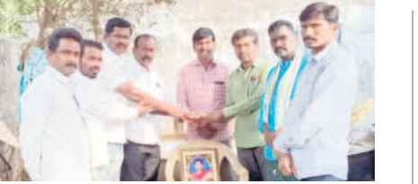
కుమ్మరికుంటలో నగదు అందజేస్తున్న పూర్వ విద్యార్థులు