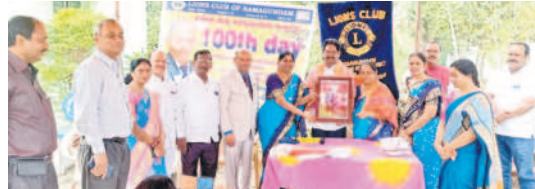
లయన్స్ క్లబ్ ప్రతినిధులను సన్మానిస్తున్న డిప్యూటీ గవర్నర్, అధ్యక్షురాలు