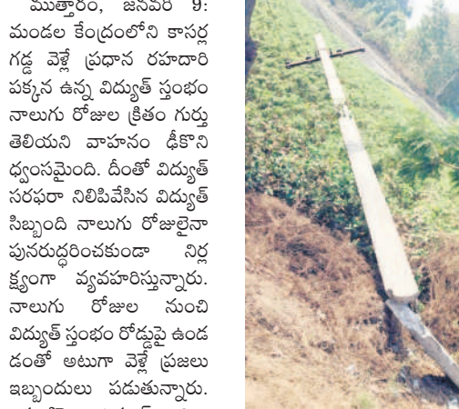
రోడ్డు పక్కనే విరిగి పడి ఉన్న విద్యుత్ స్తంభం

ముత్తూరం, జనవరి 9: మండల కేంద్రంలోని కాసర్ గడ్డ వెళ్ళే ప్రధాన రహదారి పక్కనే ఉన్న విద్యుత్ స్తంభం నాలుగు రోజుల క్రితం గుర్తు తగ్గిన వాహనం డిజీనింగ్ చేయించింది. డింకో విద్యుత్ సరఫరా నిలిపివేసిన విద్యుత్ సిబ్బంది నాలుగు రోజులైనా ప్రయత్నించినా సమాధి నిర్మించలేకపోయింది. విద్యుత్ స్తంభం పక్కనే ఉన్న విద్యుత్ స్తంభం రోడ్డుపై ఉండడంతో అలుగా వెళ్ళే ప్రజలు ఇబ్బందులు పడుతున్నారు. ఇప్పటికే విద్యుత్ అధికారులు సమస్యను పరిష్కరించాలని ప్రజలు కోరుతున్నారు.