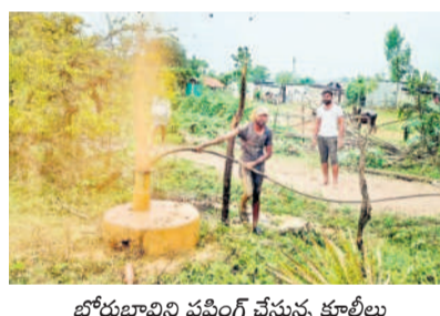
బోరుబానిస ప్లజింగ్ చేస్తున్న కూలీలు