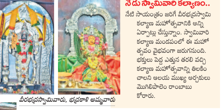
వీరభద్రస్వామివారు, భద్రకాళి అమ్మవారు