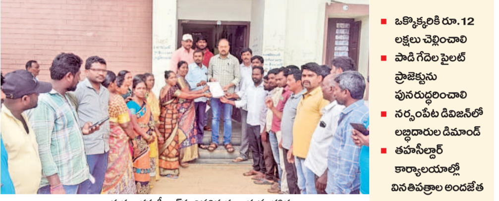
భానాపూరం: తహసీల్దార్ కు వినతిపత్రం ఇస్తున్న డ్రైవర్లు

వరణ రూపొందిస్తున్నది. ఇందుకు అనుగుణంగా లోక్ సభ ఎన్నికల సన్నాహక సమావేశాలు నిర్వహిస్తున్నది. పార్లమెంట్ లో బీఆర్ఎస్ ఎంపీలు ఉంటేనే మన హక్కుల గురించి పోరాడే వీలు కలుగుతుందని స్పష్టం చేస్తున్నది. ఇప్పటివరకు పార్లమెంట్ సమావేశాల్లో కాంగ్రెస్, బీజేపీ ఎంపీల కంటే బీఆర్ఎస్ ఎంపీలు సంధించిన ప్రశ్నలే అధికమని, బీఆర్ఎస్ ఎంపీల వల్లే కేంద్రం నుంచి పలు లీలక పనులను సాధించుకోగలిగిందని చెప్పుకున్నది.