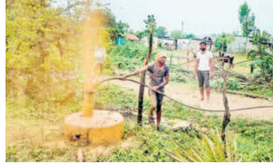
బోరుబావిని ప్లంట్ చేస్తున్న కూలీలు