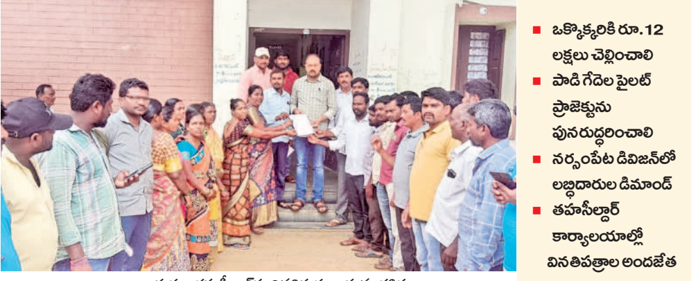
భానాపూరం: తహసీల్దార్ కు వినతిపత్రం ఇస్తున్న డ్రైవర్లు

చరణ రూపొందిస్తున్నది. ఇందుకు అనుగుణంగా లోక్ సభ ఎన్నికల సన్నాహక సమావేశాలు నిర్వహిస్తున్నది. పార్లమెంట్ లో బీఆర్ఎస్ ఎంపీలు ఉంటేనే మన హక్కుల గురించి పోరాడే వీలు కలుగుతుందని స్పష్టం చేస్తున్నది. ఇప్పటివరకు పార్లమెంట్ సమావేశాల్లో కాంగ్రెస్, బీజేపీ ఎంపీల కంటే బీఆర్ఎస్ ఎంపీలు సంధించిన ప్రశ్నలే అధికమని, బీఆర్ఎస్ ఎంపీల వల్లే కేంద్రం నుంచి పలు లీలక పనులను సాధించుకోగలిగిందని చెప్పుతున్నది.