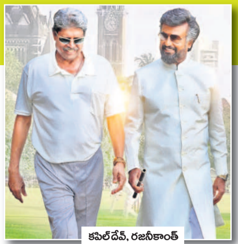
కపిల్ దేవ్, రజనీకాంత్

సూపర్ స్టార్ రజనీకాంత్ కీలక పాత్రలో నటిస్తున్న చిత్రం 'లాల్ సలామ్'. ఈ సినిమాలో తెలంగాణ క్రికెట్ కపిల్ దేవ్ అతిథి పాత్రను పోషించారు. విష్ణు విశాల్, విక్రాంత్ హీరోలుగా నటించారు. ఐశ్వర్య రజనీకాంత్ దర్శకురాలు. లైకా ప్రొడక్షన్స్ నిర్మించిన ఈ చిత్రాన్ని ఫిబ్రవరి 9న పాస్ ఇండియా స్టూడియో విడుదల చేయబోతున్నారు. ముంబయి నేపథ్యంలో క్రికెట్ ప్రధానంగా నడిచే ఈ కథలో మొయినుద్దీన్ భాయీగా శక్తివంతమైన పాత్రలో రజనీకాంత్ కనిపించబోతున్నారు. భిన్న మతాలకు చెందిన ఇద్దరు మిత్రులకు క్రికెట్ అంటే ప్రాణం. అయితే మతం పేరుతో గొడవల వల్ల వారు ఆటకు దూరమయ్యే పరిస్థితి వస్తుంది. ఈ నేపథ్యంలో మొయినుద్దీన్ భాయీ వారి మధ్య ఉన్న విద్వేషాలను ఎలా తొలగించాడు? ఇరు వర్గాలు సఖ్యతతో జీవించేందుకు ఏం చేశాడన్నది ఈ సినిమా కథాంశమని దర్శకుడు తెలిపారు. రిలీజ్ డేట్ అన్నామెంట్ పోస్టర్లో సూపర్ స్టార్ రజనీకాంత్, క్రికెట్ లెజెండ్ కపిల్ దేవ్ చిరునవ్వులు చిందిస్తూ కనిపిస్తున్నారు. ఈ చిత్రానికి సినిమాలో గ్రేడ్, విష్ణు రంగస్థాయి, సంగీతం: ఎ.ఆర్.రెహమాన్, నిర్మాత: సుభాస్కర్, స్క్రీన్ ప్లే, దర్శకత్వం: ఐశ్వర్య రజనీకాంత్.