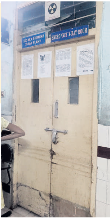
ఎమ్మెస్సీ వార్డులో ఎక్స్‌రే మిషన్ పని చేయకపోవడంతో గదికి తాళం వేసిన నిబ్బంది

వరంగల్ చౌరస్తా, జనవరి 10: ఉత్తర తెలంగాణకు పెద్ద దిక్కుగా ఉన్న వరంగల్ ఎంజీఎం వదాఖా నలో సేవలు అంతంత మాత్రంగా అందుతున్నాయని రోగులు వాపోతున్నారు. ఎమ్మెస్సీ వార్డులో ఎక్స్‌రే మిషన్ పనిచేయక వారం గడుస్తున్నా అధికారులు పట్టించుకోవడం లేదని క్షతగాత్రులు ఆవేదన వ్యక్తం చేస్తున్నారు. ఈ నెల మూడో తేదీ తెల్లవారుజామున ఎక్స్‌రే మిషన్ మొరాయింపడంతో సేవలు నిలిచిపోయాయి. అత్యవసర చికిత్స పొందుతున్న రోగులను ప్రైవేట్ రేడియాలజీ విభాగానికి తరలించాల్సి వస్తున్నా మరమ్మత్తుల విషయంలో అధికారులు స్పందించడం లేదనే విమర్శలు వెల్లువెత్తుతున్నాయి. ప్రమాదాల్లో గాయపడిన వారి ఎముకల స్థితిని తెలుసుకునేందుకు ఎక్స్‌రే తీయాలి అంటుంది. అయితే, అత్యవసర విభాగంలో అందుబాటులో లేకపోవడంతో రోగులతోపాటు వైద్య సిబ్బంది సైతం ఇబ్బందులు ఎదుర్కోవాల్సి వస్తున్నా సంబంధిత అధికారులు మాత్రం నిమ్మకు నీరెత్తినట్లు వ్యవహరిస్తున్నారనే ఆరోపణలు వెల్లువెత్తుతున్నాయి.