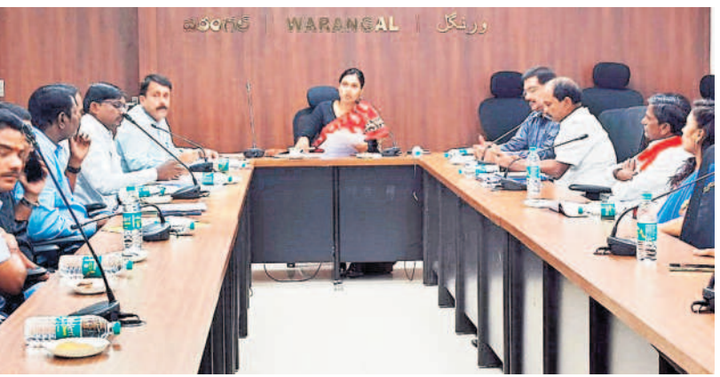
మిర్చి క్రయ, విక్రయాలు అధికారులతో సమీక్ష నిర్వహిస్తున్న కలెక్టర్ ప్రావీణ్య

పలువురు ఎంజీఎం ఉద్యోగులు, సిబ్బంది సైతం బహుళంగంగానే చెబుతున్నారు. అయితే వైద్య సిబ్బల్లో ఎలాంటి అటంకాలు లేవని, అన్ని రకాల రసాయనాలు అందుబాటులోనే ఉన్నాయని ఇటీవల డిసెంబర్ 31న జరిగిన సమీక్షలో అటవీ, పర్యావరణ, దేవాదాయ శాఖ మంత్రి కొండా సురేష్ తెలియజేయడంతోపాటు భవిష్యత్లో ఇబ్బందులు కలుగకుండా చూడాలని ఆదేశాలు జారీ చేశారు. అయినా అధికారులు అందుకు తగిన విధంగా స్పందించకపోవడంపై సర్వత్రా విమర్శలు వ్యక్తమవుతున్నాయి. ఇప్పటికైనా ఉన్నతాధికారులు స్పందించి వైద్య సేవలు నిరాటంకంగా కొనసాగేలా చర్యలు తీసుకోవాలని రోగులు, అభివేదికల కోరుతున్నారు.