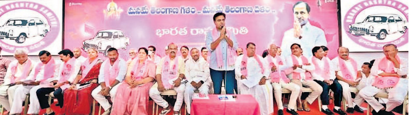
హైదరాబాద్‌లోని తెలంగాణ భవన్‌లో నిర్వహించిన వరంగల్ లోక్‌సభ నియోజకవర్గ పరిధి ముఖ్యమంత్రి సమావేశంలో మాట్లాడుతున్న కేటీఆర్