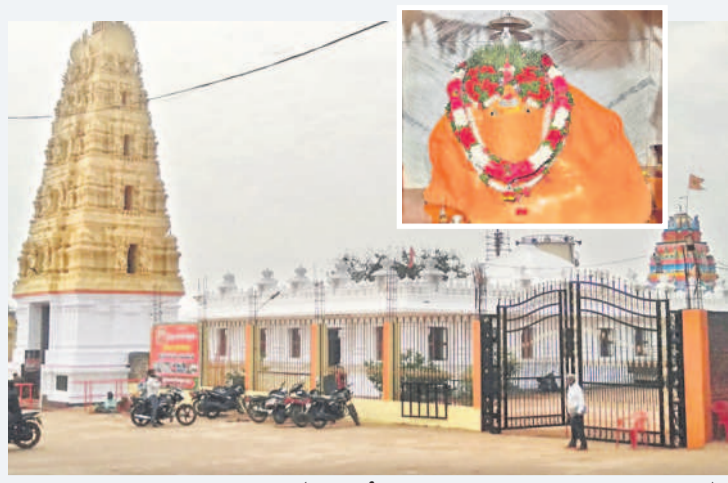
సిద్దివినాయక స్వామివారి ఆలయం (ఇన్సిట్లో స్వయంభూ సిద్దివినాయక స్వామి విగ్రహం)