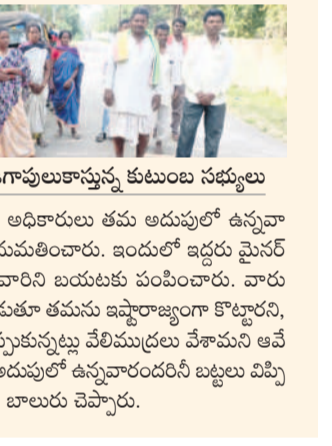
పిల్లల కోసం పడిగాపులుకొస్తున్న కుటుంబ సభ్యులు