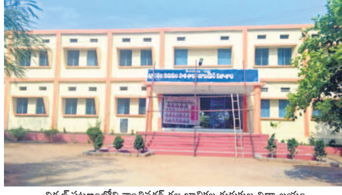
నిర్మల్ పట్టణంలోని శాంతినగర్ గల బాలికల గురుకుల విద్యాలయం

గురుకులం పాఠశాలలో బందీ తరగతి ప్రవేశానికి రాష్ట్ర ప్రభుత్వం ఆన్లైన్లో దరఖాస్తులను స్వీకరిస్తున్నది. మౌలిక వసతులు, నాణ్యమైన భోజనం, బోధన ఉండడంతో విద్యార్థులు చేరడానికి ఉత్సాహం చూపుతున్నారు. దీంతో ప్రభుత్వం ప్రవేశ పరీక్ష నిర్వహించి విద్యార్థులను ఎంపిక చేసుకుంటున్నది. ప్రతిభ ఆధారంగా ప్రవేశాలు ఉండడం, వందలాది స్థితిక వేలాది మంది పాఠీ పడుతుండడంతో విద్యార్థులు కోరింది బాట పడుతున్నారు. మూడు, ఆరు, ఏడాది పాటు శిక్షణ తీసుకుని సీటు దక్కించుకుంటున్నారు.