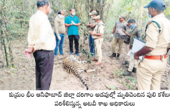
కుప్రం టీం అసిఫాబాద్ జిల్లా దరిగాం అడవులో మృతిచెందిన పులి కళేబరన్నా పరిశీలిస్తున్న అటవీ శాఖ అధికారులు