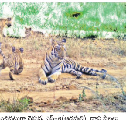
అధికారులు పాదముద్రలు గుర్తించినట్లుగా చెప్పున ఎన్-8(ఆడపులి), దాని పిల్లలు

మంచిర్యాల, జనవరి 11 (నమస్తే తెలంగాణ ప్రతినది) : విషప్రయోగంతో పులులు చనిపోయిన ఘటనతో ఒక్కసారిగా ఉలిక్కి పడ్డ జిల్లా అటవీ శాఖ, మిగిలిన పులుల జాడ కోసం అడవిని జల్లెడ పడుతున్నది. బుడవారం మొదటి రోజు 70 ట్రాప్ కర్తతో 15 బృందాలుగా విడిపోయి గాలింపు చేపట్టిన అధికారులు, రెండోరోజైన గురువారం 120 మంది ట్రాప్ కర్తతో 13 బృందాలుగా విడిపోయి గాలింపున్నారు. రెండు పులులు మృతి చెందిన కాగజేనగర్ డివిజన్ పరిధిలోని దరిగాం అటవీ ప్రాంతంలో పాటు అసిఫాబాద్, సిర్పూర్ డివిజన్ లోనూ అన్వేషిస్తున్నారు. అసిఫాబాద్ డివిజన్ పరిధిలోని వాంకిడి మండలం సర్పేపల్లి చుట్టూ ఉన్న మూడు సురక్షితంగా ఉన్నాయనుకుంటే, వాటి పిల్లలైన మరో రెండు పులుల పాదముద్రలు గుర్తించినట్లు విశ్వసనీయంగా తెలిసింది. ఎన్-9, ఎన్-15 మృతి చెందగా, ఎన్-9(మగపులి), జతగా ఉన్న ఎన్-8(ఆడపులి)తో పాటు మూడు సురక్షితంగా ఉన్నాయనుకుంటే, వాటి పిల్లలైన మరో రెండు పులుల పాదముద్రలు గుర్తించినట్లు తెలిసింది. దీంతో ఆ మూడు పులులు సురక్షితంగా ఉన్నట్లు అధికారులు భావిస్తున్నారు. ఈ పులుల జాడను ట్రాక్ చేసేందుకు కాగజేనగర్, అసిఫాబాద్, సిర్పూర్ తో పాటు గురువారం మంచిర్యాల, బెల్లంపల్లి, చెన్నూర్ నుంచి ట్రాప్ కర్త బృందాలు