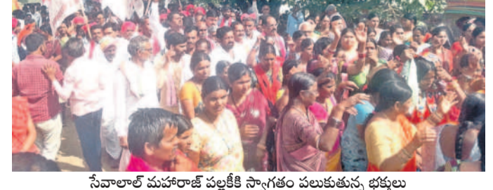
సేవాలాల్ మహారాజ్ పల్లెటి స్వాగతం పలుకుతున్న భక్తులు