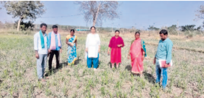
సీతాయిపల్లి శివారుల్లో పంటల పరిశీలిస్తున్న ఏడీపి రక్షణ

● ఎల్లారెడ్డి ఏడీపి రక్షణ ● యానంగి పంటల పరిశీలన గాంధారి, జనవరి 11: మండలంలోని గండివేలి, సీతాయిపల్లి శివారుల్లో రైతులు యానంగిలో సాగుచేస్తున్న పలు రకాల పంటలను ఎల్లారెడ్డి ఏడీపి రక్షణ గురువారం పరిశీలించారు. ఈ సందర్భంగా ఆమె మాట్లాడుతూ.. రైతులు సాగుచేస్తున్న మక్కజొన్న పంటలో భాస్కరం లోపంతోపాటు, కాండం తొలప పురుగు ఆశించినట్లు తెలిపారు. భాస్కరం లోపం నివారణకు ఎంపీకే పోకాలు ఉన్న 28:28:0 అనే మందును లేదా 19:19:19 అనే మందును ఎకరానికి ఒక కేజీ చొప్పున పిచి కాల్ చేయాలని సూచించారు. కాండం తొలప పురుగు నివారణకు ఎమ్మోమోక్షన్ బెంజోయేట్ 5 శాతం మందును ఎకరా