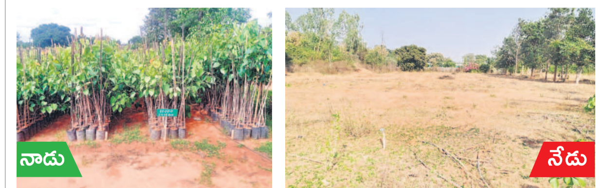
నాడు కళకళ.. నేడు వెలవెల

మంచెర్లాలలోని సన్మూర్, జనవరి 11: సన్మూర్ లోని కలెక్టరేట్లో స్వాతంత్ర్య సమరయోధుడు,