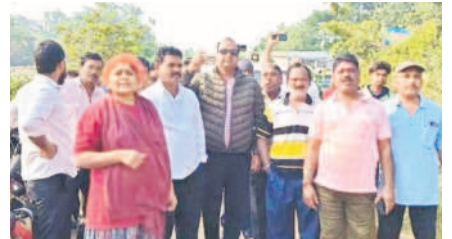
చెత్తవాహనాలను అడ్డుకున్న బస్టివాసులు