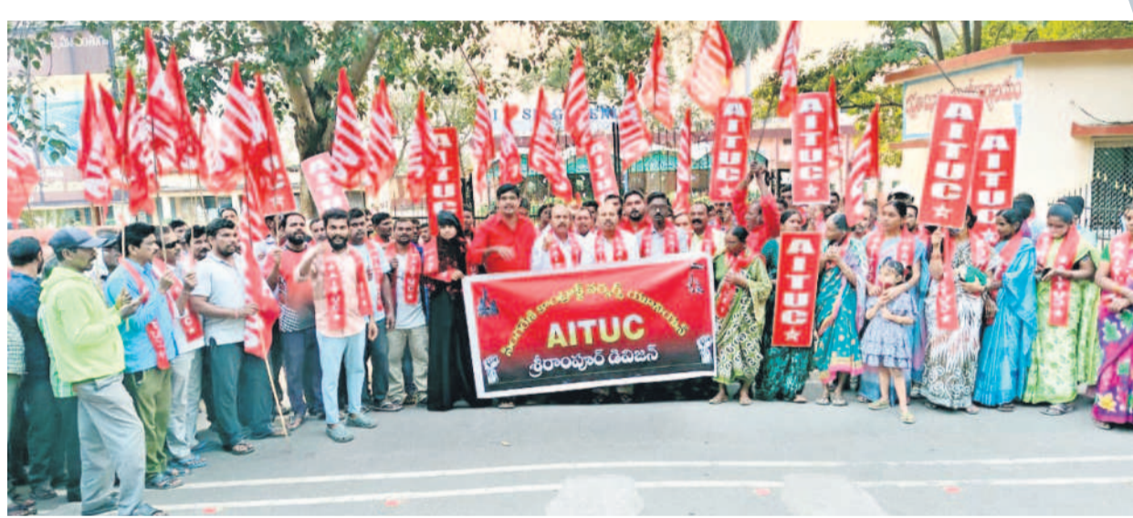
శ్రీరాంపూర్ జీఎం ఆఫీస్ ఎదుట ధర్నా చేస్తున్న కాంట్రాక్టు కార్మికులు