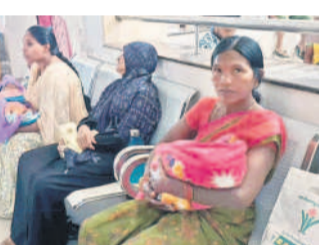
వ్యాక్సిన్ కోసం ఎంసీహెచ్ కు వచ్చిన మహిళలు