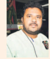
రాజకుమార్, ప్రయాణికుడు (కమాన్ ఫ్యూర్)

నిర్దిష్ట బస్సాండ నిలబడి నిలబడి యాజ్ఞకల్పింది. అక్కడి నుంచి ఒక పైవేట్ వెళ్లిపోతే కరీంనగర్ వచ్చినా.. ₹140 తీసుకున్నాడు. ఇక్కడి నుంచి నేను వెళ్లాలికి, అక్కడి నుంచి కమాన్ ఫ్యూరల్ వెళ్తా. ఇక్కడ కూడా నిర్దిష్ట లెక్కనే ఉంది. ఒక్క బస్సు వస్తు లేదు. చీకట్లెత్తంది. చిటి పెడుతుంది. ఇంటికి ఎట్ట పోవడం అర్థమైతే లేదు. పోయేసరికి ఏ రాత్రియంతో.. పండుగ పూటవైనా కొన్ని ఎక్కువ బస్సులు వేస్తే బాగుండు. కరీంనగర్ అన్ని ప్రాంతాలకు ఇంజనీ లెక్కలే ఉంటే. కనీసం ఇక్కడి నుంచి బస్సులు వెళ్లాలి బాగుండు.