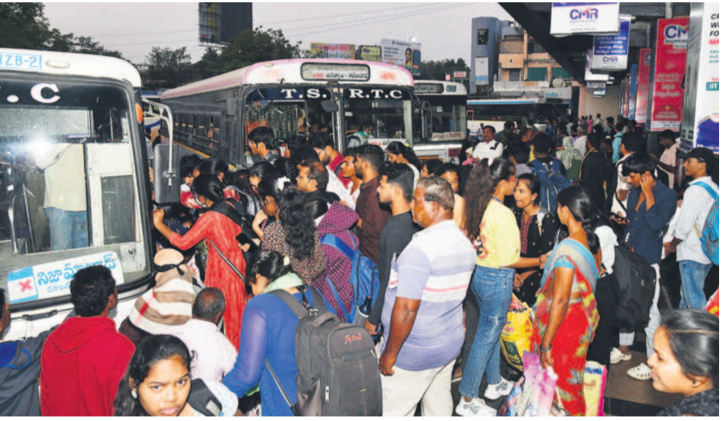
కరీంనగర్ బస్ స్టేషన్లో ప్రయాణికులు

సంక్రాంతి పండుగ వేళ ఆర్డీసీ చుక్కలు చూపుతున్నది. సాంతాక్షణ్ వెళ్లాలనుకునే ప్రయాణికులకు సరకం చూపబడుతున్నది. రద్దీకి సరిపడా బస్సులు సడపక ఇబ్బందులకు గురి చేస్తున్నది. బస్సుల సంఖ్య పెంచుతామని ప్రభుత్వం ప్రకటించినా.. ఇప్పటి వరకు ఒక్క బస్సును కూడా పెంచకపోవడంతో వ్యయప్రయాసలకోసం ఇళ్లకు చేరుకోవాల్సి వస్తున్నది. కుటుంబ సమేతంగా ప్రయాణిస్తున్న వారితో లగజీ, పిల్లలను వెంటేసుకొని గంటల తరబడి బస్సుల కోసం బస్ స్టేషన్లో నిరీక్షించాల్సి దుస్థితి ఉన్నది. రాత్రి వేళ పిల్లలు, వృద్ధులు అనేక ఇబ్బందులు పడతూ వున్నాయి. ఇంజనీల వారసు కరీంనగర్ బస్ స్టేషన్ నాలుగైదు రోజుల నుంచి ఎప్పుడు చూసినా వేలాది మందితో కిక్కిరిసిపోయి కనిపిస్తుండగా, 'బస్సు ఎప్పుడొస్తాడా..?' అని ఎదురుచూస్తున్నారు. హైదరాబాద్ జేటీఎన్ నుంచి కరీంనగర్, గోదావరిఖని, మందిరాల, ఆసిఫాబాద్ తదితర పట్టణాలకు రావడానికి అభ్యుక్తులు పడుతున్నాడు. సీటు కోసం చూస్తే ఇంటికి వెళ్లే పరిస్థితి లేక నిలబడి ప్రయాణిస్తున్నారు. స్పెషల్ బస్సుల్లో 50 శాతం అదనపు చార్జీలు వెల్లడినా సీటు దొరకనిల్లుండే వెళ్తున్నారు. పండగ సందడి మొదలైనప్పటి నుంచి ఏ ఊరి బస్సును చూసినా కిక్కిరిసి వెళ్తున్నది. ప్రయాణికులను కుక్కీ కుక్కీ పంపిస్తుండగా, ఓవర్లోడ్తో బస్సులు మొరాయింనే దుస్థితి ఏర్పడుతున్నది.