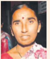
ప. రాజ్యం తది..

బస్సాండకచ్చి గంటపుర అయితే.. మా పూర్వార్లుకు వాయితానికి ఒక్క బస్సులే లేదు. వచ్చిన బస్సుకు ఎగవడి ఎక్కుతున్నారు. ఒకల మీదొకలపడి ఎక్కుతున్నారు. నేను కింద పక్కనని ఎక్కలేక పోతున్నా. ఇట్టే ఉంటే ఈ రాత్రికి కరీంనగర్ బస్సాండనే ఉండడే తో.. ఎండో. బస్సులు ఎక్కువ నడిపితే ఈ ప్రాంతం పక్కం, ప్రయాణికులు (మల్లాపూర్)