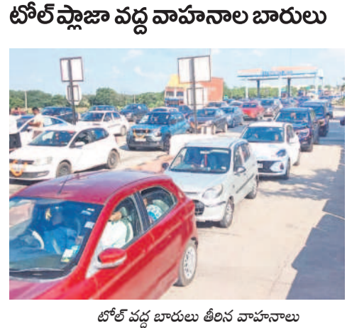
టోల్ వద్ద బారులు తీరిన వాహనాలు

తిమ్మాపూర్, జనవరి 11 : హైదరాబాద్ నుంచి కరీంనగర్ వైపు వస్తున్న వాహనాలతో మండలంలోని రోడ్డుకుంట టోల్ ప్లాజా కిక్కిరిసిపోయింది. శనివారం ఉదయం నుంచి రద్దీ వరకు రద్దీ కొనసాగు తూనే ఉన్నది. ఒక్కోసారి వాహనదారులకు 20 నిమిషాలు సమయం పట్టింది. దీంతో పలువురు వాహనదారులు సిబ్బందితో ఘర్షణ పడ్డారు. వాహనదారులు ఇబ్బందులు పడకుండా నిర్వాహకులు ప్రాఫిట్ క్లియర్ చేశారు.