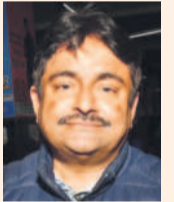
జి.వి. ప్రయాణికుడు (నిజామాబాద్)

నేను నిజామాబాద్ పోదామని స్వామి తో కలిసి కరీంనగర్ బస్ స్టాండ్ వచ్చినా.. గంటకు మీదనే అయింది. ఒక్క బస్సు లేదు. ఇక్కడ చూస్తే సరకం కనిపిస్తుంది. మళ్ళీ మంది ఇబ్బంది పడుతున్నారు. చిన్న పిల్లలు చలికి వణికి పోతున్నారు. ఎక్స్ ప్రెస్ లు కూడా కుక్కీ కుక్కీ ఎక్కిస్తున్నాయి. ఇది పోతే ఇంకో బస్సు రాదని ఆర్డీసీ వాళ్లే చెప్పారు. దూర ప్రాంతాలకు వెళ్లే వాళ్లయినా నిలబడి పోతున్నాడు.