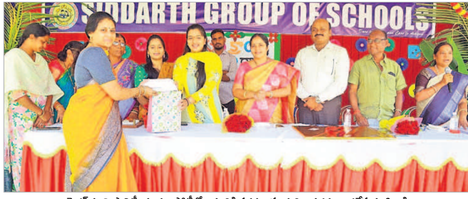
మెడక్ మున్సిపాలిటీ : ముగ్గుల పోటీల్లో అవంతికి ప్రథమ బహుమతిగా నగదు అందజేస్తున్న శివారీ