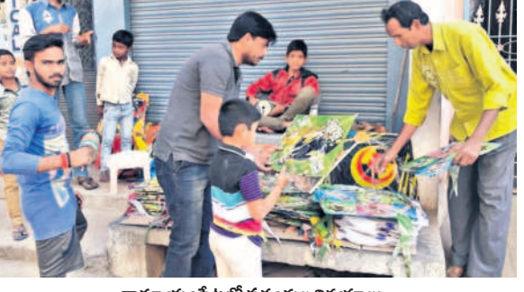
రామాయంపేటలో పతంగం విక్రయాలు