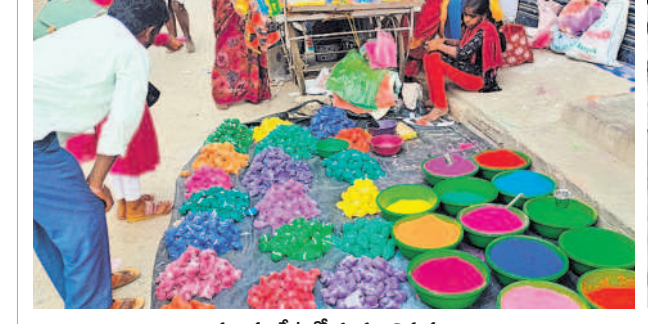
రామాయంపేటలో రంగుల విక్రయాలు

మెడక్ క్రైమ్ నకిలీ నంబర్లతో జాగ్రత్త మెడక్ క్రైమ్ నకిలీ నంబర్లతో జాగ్రత్త