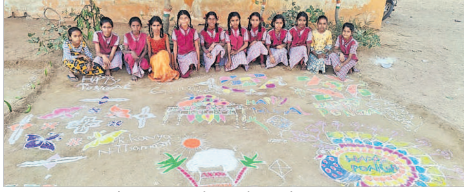
చేగుంట : మక్తరాజుపేటలో పాఠశాలలో ముగ్గులు వేస్తున్న విద్యార్థినులు