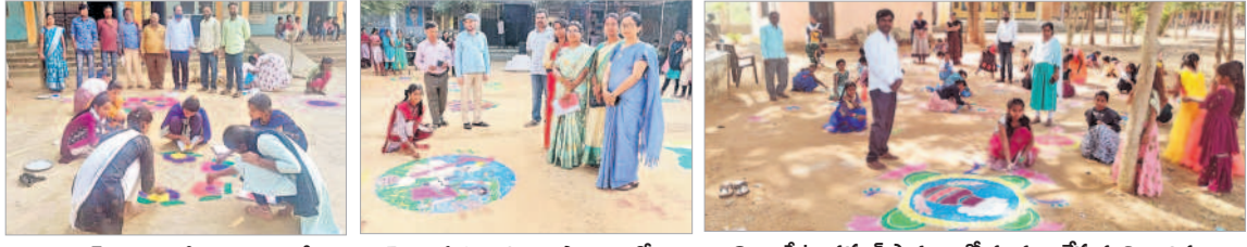
బిలిపెడెడ్ : సోమకృష్ణ పాఠశాలలో.. వెల్పల్లి ప్రభుత్వ ఉన్నత పాఠశాలలో.. నిజాంపేట : నన్యల్ పాఠశాలలో ముగ్గులు వేస్తున్న విద్యార్థినులు