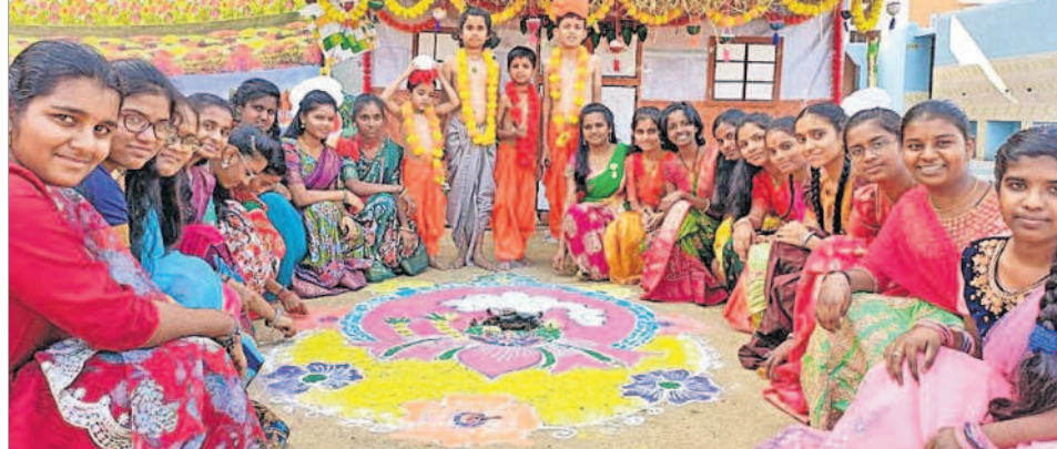
రామాయంపేట : సంక్రాంతి పండుగ వేషధారణలో విద్యార్థులు