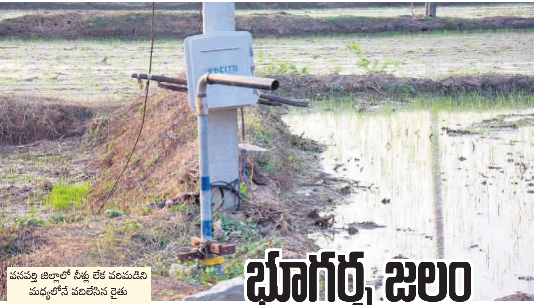
వనపర్తి జిల్లాలో స్థిర లేక పరిమడించు మధ్యలోనే వదిలేసిన రైతు