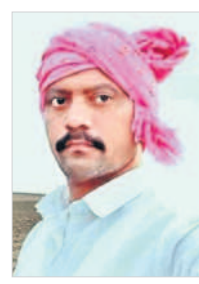
రైతులు అల్లం చేసుకోవాలి..

నారు పోసి అమ్మకున్న.. యాసంగిలో నాలుగు వేసుకుంటున్న రెండు పంటలు పడుతుంటున్నాయి. రెండో పంటను పడుతుంటున్నాయి. రెండో పంటను పడుతుంటున్నాయి. రెండో పంటను పడుతుంటున్నాయి.