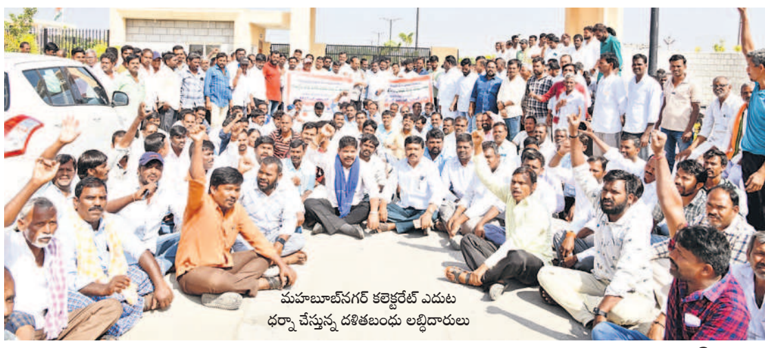
మహబూబ్ నగర్ కలెక్టర్ లో ఎదురు దర్శనం చేస్తున్న దళితబంధు అభిదారులు

కలెక్టర్ లో ప్రపంచ వికలాంగుల దినోత్సవాన్ని సందర్భించి శాఖాధికారులు అభినందనలు నిర్వహించి ఎమ్మెల్యేలను ఆహ్వానించారు. అయితే దళితబంధును, వైద్యం, వైద్యం, వైద్యం