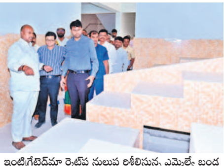
ఇంటిగ్రేటెడ్ మా ర్యేల్వీసు నులుపరి శీలన పనిపూర్తిగా పూర్తి చేయాలని ఆదేశించారు.