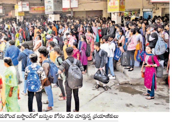
హనుమకొండ బస్స్టేషన్లో బస్సు ఎక్కుతున్న ప్రయాణికులు

సీట్ల కొరత వల్ల పాట్లు పండుగ వేళ రద్దీగా బస్ స్టేషన్లు హనుమకొండ బస్స్టేషన్లో బస్సు ఎక్కుతున్న ప్రయాణికులు