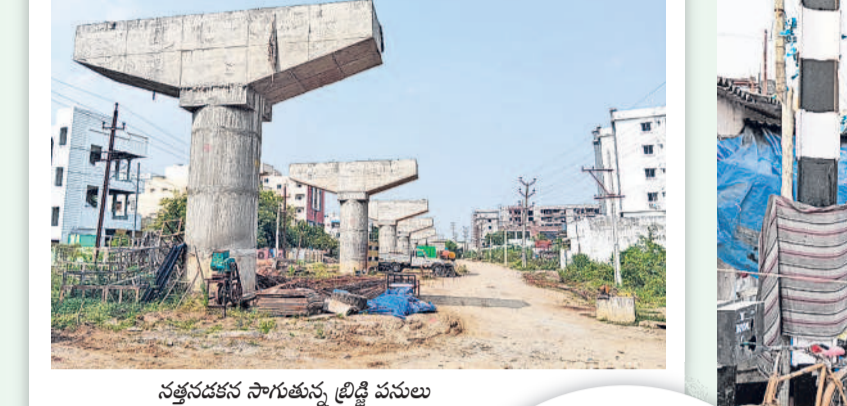
నత్తనడక సాగుతున్న ట్రిడ్డి పనులు

12 వరంగల్, ఆదివారం 12 జనవరి 2025 HANUMAKONDA