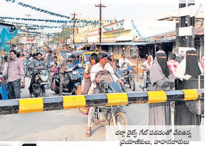
దర్గా రైల్వే గేట్ పడడంతో వేచిఉన్న ప్రయాణికులు, వాహనదారులు

బీఆర్ఎస్ హయాంలోనే బ్రెడ్డికి నిధులు మంజూరు రెండున్నరేళ్ల నుంచి నత్తనడక పనులు ఓ పక్క ఇంకా మొదలు కాని నిర్మాణం ఇంకెన్నాళ్లు నిరీక్షించాలని ప్రయాణికులు ఆగ్రహం పదుల సంఖ్యలో ఉన్న విలీన గ్రామాల ప్రజలు దర్గా కాజీపేట రైల్వే గేట్ మీదుగానే నగరానికి వెళ్లాలి. ఇక్కడ గేట్ వదిలించడం ఒక్కోసారి అర గంటకు పైగా వేచి ఉండాలి. నిత్యం వాహనాలను గేట్ కింది నుంచి వంచుతూ సర్కస్ ఫీట్లు చేయడం ఖరామామూలే. ఒకవేళ అత్యవసరమైతే సుమారు 10 కిలోమీటర్ల చుట్టూ తిరిగి రావాలి. ఇక్కడి ప్రజల కష్టాలను దృష్టిలో పెట్టుకుని గత బీఆర్ఎస్ ప్రభుత్వం రెండున్నరేండ్ల క్రితం పై ఓపర్ బ్రెడ్డి నిర్మాణం చేయడం నిధులు మంజూరు చేసింది. అప్పటి నుంచి పనులు నత్తనడక నడుస్తుండగా, ఓ పక్క ఇంకా మొదలే పెట్టలేదు. రైల్వే గేట్ తిప్పలు తప్పేదెప్పుడని స్థానికులు, ప్రయాణికులు ప్రశ్నిస్తున్నారు.