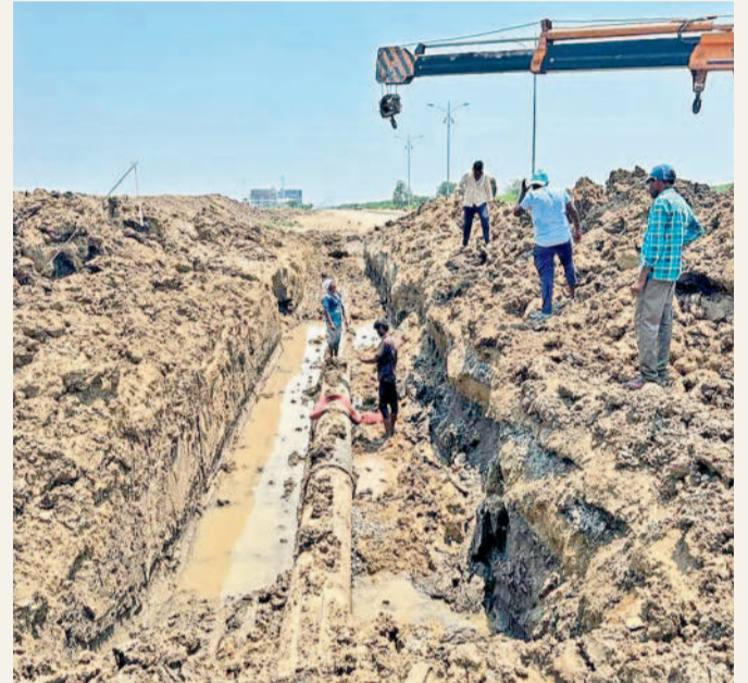
శాయంపేట : చలివారి నుంచి ట్రాక్టర్లతో పారుతున్న పైపులైన్ పనులు

ములుగు, జనవరి 12 (నమస్తే తెలంగాణ) : మేడారం జాతర పరిధిలో విలేజ్ డెవలప్ మెంట్ కమిటీల అనుమతి లేకుండానే అభివృద్ధి పనులు చేపట్టడం సాధిక గ్రామ పాలకులు, వీడిసీల సభ్యుల్లో ఆగ్రహానికి కారణం వచ్చింది. జాతర అభివృద్ధిలో నామినేట్ చేసిన వీడిసీల అనుమతి తప్పని సరి. గతంలో సర్పంచ్, పాలకర్ష సభ్యులు, వీడిసీల అనుమతి తీసుకున్నాకే పనులు చేపట్టారు. అగ్రిమెంట్ అనుమతి లేకుండానే ప్రారంభించాల్సి ఉంటుంది. కానీ గిరిజన సంక్షేమ శాఖ అధికారులు ఇందుకు విరుద్ధంగా వ్యవహరిస్తూ తూకం త్రోసి అనుమతి కాని పనులు చేపట్టారని సర్పంచ్ అభివృద్ధి విభాగం వారు ఆరోపణలు చేస్తున్నారు. గ్రామాలలో అభివృద్ధికి రావాల్సిన నిధులు కాంట్రాక్టర్లకు కట్టడం అభివృద్ధి అధికారులు వ్యవహరిస్తున్నారని, పంచాయతీల అనుమతి, వీడిసీల ప్రయోగం లేకుండానే పనులు చేసేందుకు సిద్ధమయ్యాడని, వీడిసీల అనుమతి లేకుండానే అభివృద్ధి పనులు చేపట్టారని ఆరోపణలు చేస్తున్నారు.