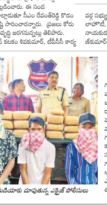
గంజాయి, నిందితులను మీడియాకు చూపుతున్న ఎస్పీ పోలీసులు