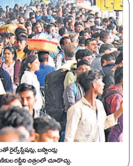
నంద్యాలి సందర్భంగా సాంఘిక కార్యకర్తలతో ప్రయాణికులతో రైల్వే స్టేషన్, బస్టాండ్ కిరీకలారుచున్నాయి. సికింద్రాబాద్ రైల్వే స్టేషన్లో ప్రయాణికుల రద్దీని చిత్తంలో చూడటం.