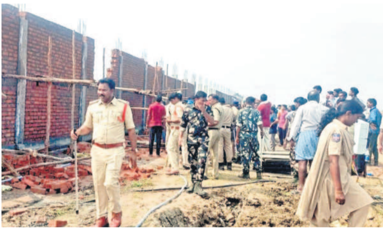
పనులు అడ్డుకుంటున్న వారిని చెదరగొడుతున్న పోలీసులు (ఫైల్)

ఫ్యాక్టరీ పనులను ప్రారంభించడంతో రైతుల ఆగ్రహం రెట్టింపైంది. ఇటీవల ఫ్యాక్టరీని ముట్టడించి నిర్మాణంలో ఉన్న ప్రజానీకం, ఆస్తులను ధ్వంసం చేశారు. దీంతో పరిస్థితి ఉద్రిక్తంగా మారింది. పోలీస్ అధికారులతో పాటు, అడిషనల్ కలెక్టర్ సంఘటనా స్థలానికి చేరుకొని రైతులను శాంతిపఠికం చేశారు. సమస్య తీవ్రతను ప్రభుత్వం దృష్టికి తీసుకెళ్లమని హామీ ఇచ్చారు. అయినా రైతులు తమ నిరసనను కొనసాగిస్తున్నారు. నిర్మల్-బ్రింసా ప్రధాన రహదారిపై వంటా వార్లు కార్యక్రమం నిర్వహించి తమ నిరసనను తెలిపేశారు. ఇప్పటికైనా ప్రభుత్వం ఫ్యాక్టరీపై సరైన నిర్ణయం తీసుకుంటుంటే లేదే వేచి చూడాలి.