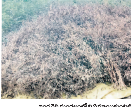
ఇండ్రవెల్లి మండలంలోని ఏమాయికుంటలో కొనిన కంది పంట

ఆదిలాబాద్, జనవరి 14 (నమస్తే తెలంగాణ) : ఆదిలాబాద్ జిల్లావ్యాప్తంగా గత వారంకాలంలో 60,818 ఎకరాల్లో కంది సాగింది. వర్షాలు, వాతావరణ పరిస్థితులు అనుకూలించడంతో దిగుబడులు అశాజనకంగా ఉన్నాయి. ఎకరాకు ఆరు క్వింటాళ్ల చొప్పున 3.64 లక్షల క్వింటాళ్ల దిగుబడులు వచ్చే అవకాశాలు ఉన్నట్లు అధికారులు అంచనా వేశారు. కాగా.. ఈ నెల 15వ తేదీన అదనపు కలెక్టరీతో మార్కెటింగ్, పుష్కలం, మార్కెట్, ఇతర శాఖల అధికారులతో సమావేశం జరుగుతుంది. ఇందులో కందుల కొనుగోళ్ల విషయంలో తీసుకోవాల్సిన విషయాలపై చర్చిస్తారు. ఈ నెల 19వ తేదీ నుంచి కొనుగోళ్ల ప్రారంభమయ్యే అవకాశాలు ఉన్నాయని అధికారులు తెలిపారు. మార్కెట్ యార్డుల్లో మార్కెట్ డ్వారా పంట ఉత్పత్తుల సేకరణ జరుగుతుంది. మద్దతు ధర క్వింటాల్ కు రూ. 7 వేలు ఉండగా, ప్రైవేటు వ్యాపారులు రూ. 8,500 చెల్లిస్తున్నారు. మార్కెట్ అడ్డంకులు తగ్గించే వాణిజ్య కొనుగోళ్ల జరుగుతున్నాయి. ప్రైవేటు వ్యాపారులకు ధీటుగా వాణిజ్య కొనుగోళ్ల ఉండడంతో మద్దతు ధర కంటే