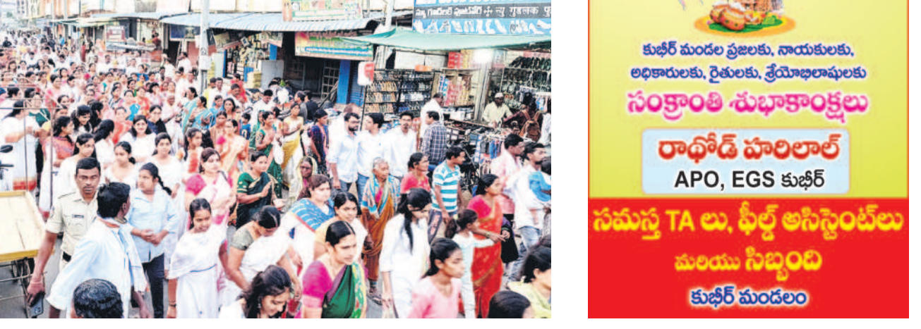
శోభాయాత్రలో పాల్గొన్న భక్తులు