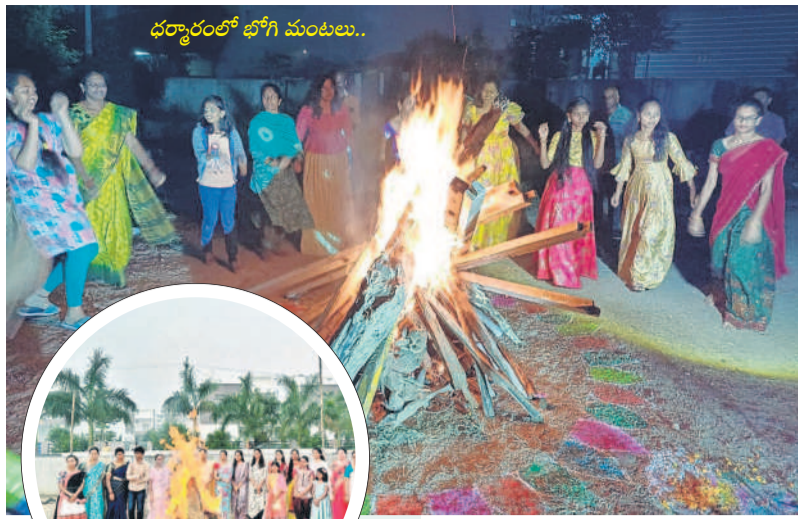
ధర్మాచార్యులు భోగి మంటలు..