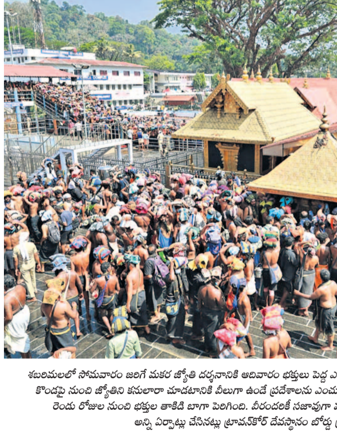
శబరిమలలో సోమవారం జరిగే మకర షోకీ దర్శనానికి అభివారం భక్తులు పెద్ద ఎత్తున తరలివచ్చారు. ఆలయ సమీపంలోని కొండ్లపల్లి నుంచి జ్యోతిని కనులారా చూడటానికి వీలుగా ఉండే ప్రదేశాలను ఎంచుకుని కూర్చున్నారు. ఆంక్షలు ఉన్నప్పటికీ రెండు రోజుల నుంచి భక్తుల తాకిడి బాగా పెరిగింది. వీరందరికీ సజావుగా మకర షోకీ దర్శనం కల్పించేందుకు అన్ని ఏర్పాట్లు చేసినట్లు ట్రావన్కోర్ డెవలప్మెంట్ బోర్డు ప్రకటించింది.