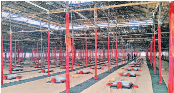
అయోధ్యలో ఏర్పాటు చేసిన హామ్ గుండాల

కాంగ్రెస్ కార్యకర్తల దర్సా నిర్వహించారు. చెందిన 5 వేల మంది కళాకారులు అయోధ్యలో జనవరి 14 నుంచి మార్చి 24 వరకు 70 రోజుల పాటు వివిధ రకాల ప్రదర్శనలు ఇస్తారని అధికారులు తెలిపారు. 15 దేశాలకు చెందిన అభివృద్ధి రామలిలా నాటకం ప్రదర్శనలకు సాగించారు. రామ మందిర ప్రారంభాన్ని పురస్కరించు కుని పవిత్ర గ్రంథం రామచరిత్రమానసకు