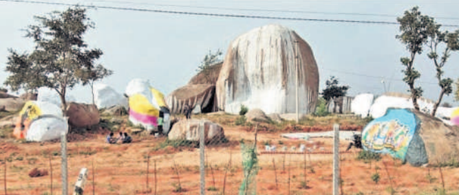
ఉత్సవాలకు ముస్తాబైన బయ్యన్న గుండ్ర