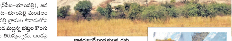
జాతర జరిగే బండ మల్లన్న గుండం

మండల పరిధిలోని గజాలపల్లి గ్రామాలకు చెందిన భక్తులు బోసం బండపై బండపై ప్రదక్షిణలు చేయడం ఇక్కడి ఆనవాయితీగా వస్తున్నది. బండపై సహజ సిద్ధంగా వెలసిన పుట్ట గుండంలో ఎన్ని కరువు కాలకాలా వచ్చినా నేటికీ నీరు పుష్పలంగా ఉండడం మల్లన్న దేవుడి మహిమగా ప్రజలు కొనియాడుతారు. పుట్ట గుండంలోని నీరును ఆయా గ్రామాల రైతులు తమ పొలాల్లో చల్లితే పంటలు బాగా పండతాయని రైతుల నమ్మకం. మల్లికార్జునస్వామి ఆలయంలో సహజ సిద్ధంగా వెలసిన సారీకెలాంటి బండలో వెలసిన కారణంగా బండ మల్లన్నగా పేరు ప్రఖ్యాతి పొందింది.