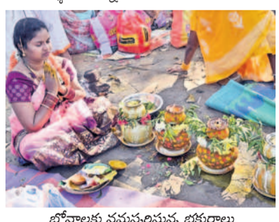
బోనాలకు నమస్కరిస్తున్న భక్తురాలు