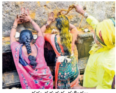
వరం పడతన్న మహిళలు

నేడు సంక్రాంతి పండుగ రోజున స్వామి వారికి ఉత్తరాయణ, పుణ్యకాలం, విష్ణుస్థూల పూజ, పుణ్యహం వాచనము, మాహాన్యకాండ రుద్రాభిషేకం, బిల్వార్చన, మహానీవేదన, సీరాజన మంత్రి పుష్కం చేయనున్నారు. రాత్రి మార్చిని వంశీయుల పెద్దబండ్ల, ఐనవోలు, ఒంటి మామడిపల్లి, ముల్గులగూడెం, పెరుమాం డ్దగూడెం గ్రామాల ప్రభు బండ్ల తిరుగుతారు.