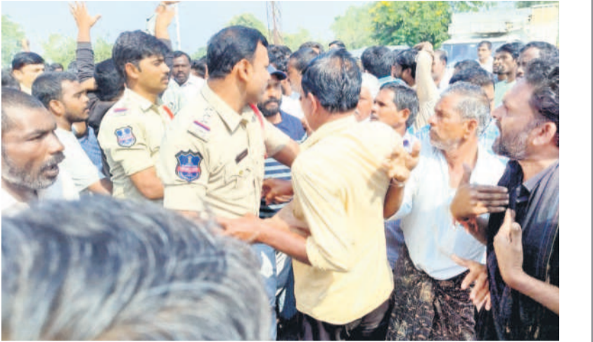
ఫ్యాక్టరీ వద్ద పోలీసులతో వ్యాధానికి దిగుతున్న రైతులు, ప్రజలు (ఫైల్)

నిర్మల్, జనవరి 14 (నమస్తే తెలంగాణ): నిర్మల్ జిల్లాలోని దిలావర్పూర్-గుండంపల్లి గ్రామాల మధ్య నిర్మించబడిన ఇథనాల్ ఫ్యాక్టరీని రైతాంగం వ్యతిరేకిస్తున్నది. అయినా యాజమాన్యం, సంబంధిత అధికారులు మొండి వైఖరిని అవలంబిస్తుండడం విమర్శలకు తావిస్తున్నది. మొదట్లో యాజమాన్యం సహాయకమైన కారణాలు చూపకుండానే ఫ్యాక్టరీ ఏర్పాటుకు అనుమతులు సాధించింది. అయితే స్థానిక రైతుల అభిప్రాయాన్ని పరిగణలోకి తీసుకోకపోవడం ప్రస్తుతం వివాదానికి కారణమవుతున్నది. యాజమాన్యం మాత్రం ఇథనాల్ ఫ్యాక్టరీ ఏర్పాటుతో అందరికీ మేలు జరుగుతుందంటూ రైతులను ముందుగా ఒప్పించింది. దిలావర్పూర్, గుండంపల్లిలో పాటు సముదాయాలి, లోలం తదితర గ్రామాల భూములు సారవంతంగా ఉండడం, సాగు నీరు పుష్కలంగా అందుబాటులో ఉన్న కారణంగా పంట దిగుబడులు అధికంగా వస్తుంటాయి. సంబంధిత యాజమాన్యం మాత్రం ఇక్కడి భూములను చౌకగా కొనుగోలు చేసింది. రైతులు, ప్రజా సంఘాలు, వీడిసీల అభివృద్ధికి తీసుకోకుండా ఫ్యాక్టరీ పనులను కొనసాగిస్తున్నది. దీంతో రైతులు ఆందోళనలు చేస్తున్నారు. ఫ్యాక్టరీని ఇక్కడి నుంచి తరలించాలని కలెక్టర్, ఇతర ఉన్నతాధికారులకు ఫిర్యాదు చేసినప్పటికీ ఎలాంటి సుందూ కనిపించలేదు.