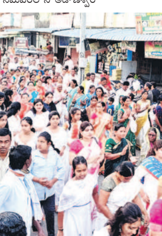
శోభాయాత్రలో పాల్గొన్న భక్తులు