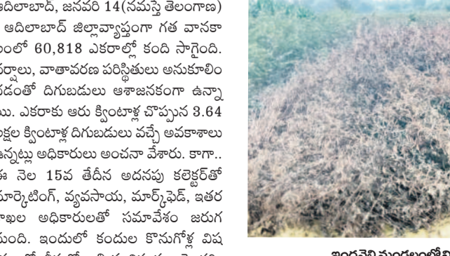
ఇంద్రవెల్లి మండలంలోని ఏమాయికుంటలో కొనిన కంది పంట