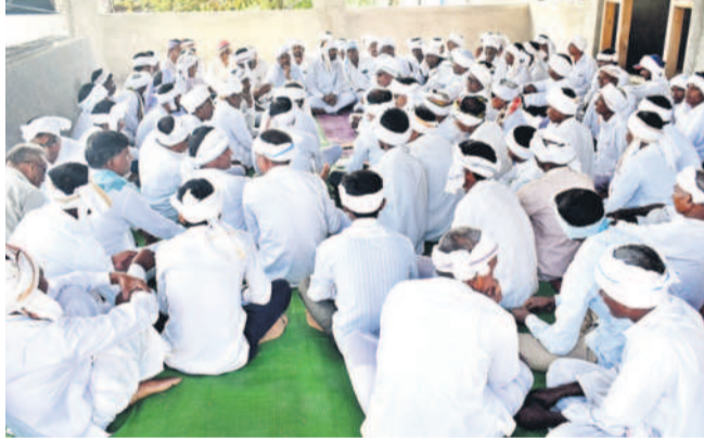
కేసెపూర్ లోని మురాడిలో ప్రచారం అడ్డుపెట్టే మార్కెట్ చరిస్తూ..