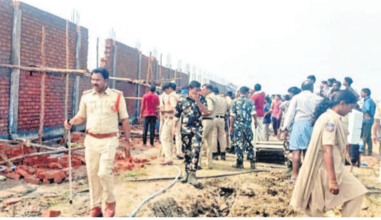
పనులు అడ్డుకుంటున్న వారిని చెదరగొడుతున్న పోలీసులు (ఫైల్)

ఫ్యాక్టరీ పనులను ప్రారంభించడంతో రైతుల ఆగ్రహం రెట్టింపైంది. ఇటీవల ఫ్యాక్టరీని ముట్టడించి నిర్మాణంలో ఉన్న ప్రజానీకం, ఆస్ట్రేలియన్ ధ్వంసం చేశారు. దీంతో పరిస్థితి ఉద్రిక్తంగా మారింది. పోలీస్ అధికారులతో పాటు, ఆడిషనల్ కలెక్టర్ సంఘటనా స్థలానికి చేరుకొని రైతులను శాంతిపఠింపారు. సమస్య తీవ్రతను ప్రభుత్వం దృష్టికి తీసుకెళ్లమని హామీ ఇచ్చారు. అయినా రైతులు తమ నిరసనను కొనసాగిస్తున్నారు. నిర్మల్-ఖైరతాబాద్ ప్రధాన రహదారిపై వంటా వార్లు కార్యక్రమం నిర్వహించి తమ నిరసనను తెలిపేశారు. ఇప్పటికైనా ప్రభుత్వం ఫ్యాక్టరీపై సరైన నిర్ణయం తీసుకుంటుంటే లేదే వేచి చూడాలి.