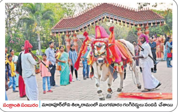
సంక్రాంతి సమయం మాదాపూర్లోని శిల్పారామంలో మంగళవారం గంగిరెద్దులు నందడి చేశాయి