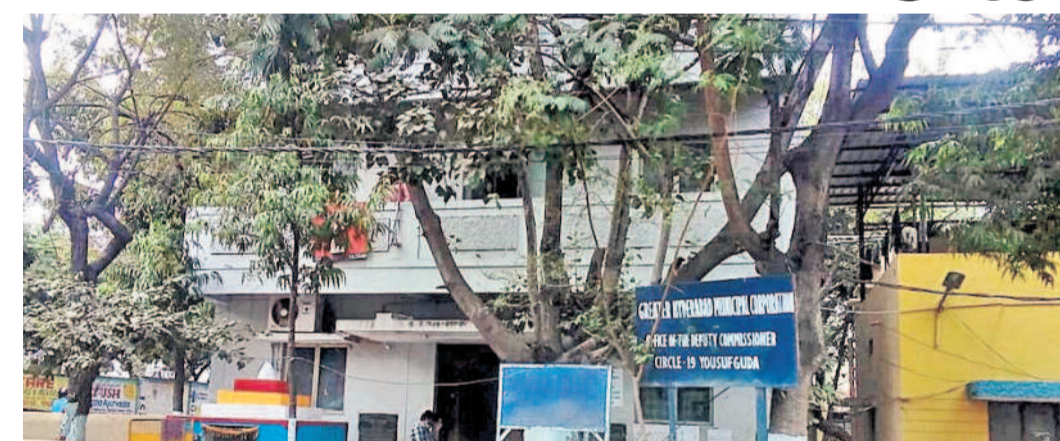
యూనుస్ గూడ జిహెచ్.ఎం.సి సర్కిల్ కార్యాలయం

జూలై 16: నగరాన్ని అభివృద్ధి పథంలో నడిపించడంలో కీలకపాత్ర పోషించే ఆస్తిపన్ను వసూలుపై జిహెచ్.ఎం.సి అధికారులు దృష్టి సారించారు. వందశాతం ఆస్తిపన్ను వసూలుతో సర్కిల్ పరిధిలోని వార్డులను అభివృద్ధి పథంలో నడిపించేందుకు అధికారులు చర్యలు తీసుకుంటున్నారు. ఇందులో భాగంగా యూనుస్ గూడ సర్కిల్ జిహెచ్.ఎం.సి అధికారులు ఆస్తిపన్ను వసూలు వేగవంతం చేస్తున్నారు. నాలుగైదు నెలలుగా ఎన్నికల పనులు, సంక్షేమ పథకాల అమలులో నిమగ్నమైన అధికారులు ఆస్తిపన్ను వసూలుకు చర్యలు తీసుకుంటున్నారు. యూనుస్ గూడ సర్కిల్ లో ఈ ఏడాది రూ. 33.73 కోట్ల ఆస్తిపన్ను వసూలు లక్ష్యంగా ముందుకెళ్తున్న అధికారులు, ఇప్పటి వరకు రూ. 18 కోట్లవే ఆస్తిపన్ను వసూలు చేశారు.