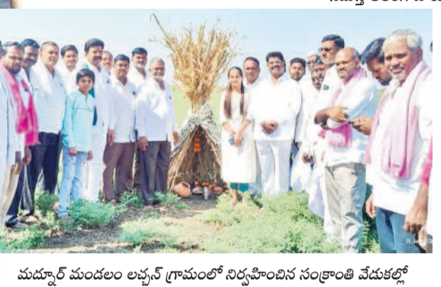
ముద్నూర్ మండలం లచ్చన్ గ్రామంలో నిర్వహించిన సంక్రాంతి వేడుకల్లో గ్రామస్థులతో కలిసి పాల్గొన్న మాజీ ఎమ్మెల్యే హనుమంత్రెడ్డి