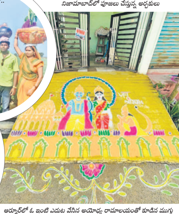
అర్చకులలో ఓ ఇంటి ఎదుట వేసిన అయోధ్య రామాలయంతో కూడిన ముగ్గు