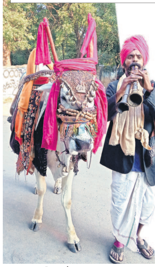
నిజామాబాద్ నగరంలో ఓ ఇంటి ఎదుట గంగిరెద్దు విన్యాసం

ఉమ్మడి నిజామాబాద్ జిల్లాలో సంక్రాంతి పండుగను ప్రజలు వైభవంగా నిర్వహించారు. మూడు రోజులపాటు సంక్రాంతి సందడితో పల్లెల్లో సందడి వాతావరణం నెలకొన్నది. హరిదాసుల కీర్తనలు, గంగిరెద్దుల విన్యాసాలు, డీజే వస్తుళ్లతో గ్రామీణ ప్రాంతాలలో పట్టణాల్లో పండుగ శోభ కనిపించింది. మహిళలు, యువతులు వేసిన రంగు రంగుల ముగ్గులతో వాళ్ళిళ్ళు మెరిసిపోయాయి. చిన్నా పెద్ద తేడా లేకుండా యువకులు, చిన్నారులు పతంగులు ఎగురవేశారు. - నమస్తే తెలంగాణ యంత్రాంగం