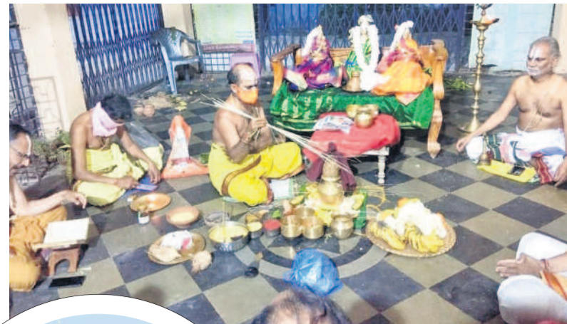
నిజామాబాద్లో పూజలు చేస్తున్న అర్చకులు

5 | నిజామాబాద్, బుధవారం 17 జనవరి 2024 | NIZAMABAD