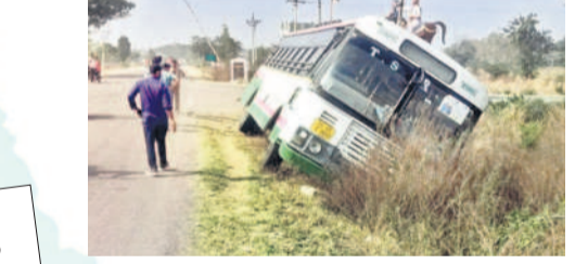
అదుపుతప్పి రోడ్డు కిందకు వెళ్ళిన ఆర్టీసీ బస్సు

గాంధారి, జనవరి 16: పాగమంచు కమ్మేయడంతో అదుపు తప్పిన ఆర్టీసీ బస్సు రోడ్డు కిందకు దూసుకెళ్ళిన ఘటన గాంధారి మండలంలోని గుడిమెట్టి గ్రామ సమీపంలో చోటు చేసుకున్నది. స్థానికులు, ఆర్టీసీ అధికారులు తెలిపిన వివరాల ప్రకారం బాన్సువాడ డిపోకు చెందిన బస్సు సోమవారం తెల్లవారుజామున బాన్సువాడ నుంచి కామారెడ్డికి బయల్దేరింది. గాంధారి మండలంలోని గుడిమెట్టి గ్రామ సమీపంలో ఉదయం 5.30 గంటలకు భారీగా పాగమంచు కురియడంతో రోడ్డు సరిగా కనిపించకపోవడంతో ఆర్టీసీ బస్సు అదుపుతప్పి రోడ్డు కిందకు దూసుకెళ్ళింది. బస్సులోని ప్రయాణికులందరూ సురక్షితంగా ఉండడంతో అంతా ఊపిరిపిల్చుకున్నారు.