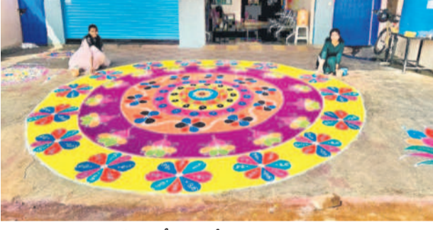
పిట్టంలో ముగ్గు వేస్తున్న యువతులు