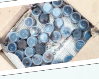
స్వాదీనం చేసుకున్న గంజాయి నూనె డబ్బాలు

గంజాయి నూనె ధర చూస్తే కళ్ళ బ్రెక్క కమ్ముతాయి. మార్కెట్లో కరోజు కిలో వెండి ధర రూ.78 వేలకు ఉంది. అంటే వెండి ధర గ్రామునకు రూ.78 వలకు ఉన్నది. అదే గంజాయి నూనె మాత్రం గ్రామునకు రూ.500 వరకు విలువ చేస్తుండటం విశేషం. కామారెడ్డి దేవులపల్లి పోలీసులకు పట్టుబడిన 190 గ్రాముల నూనె విలువ రూ.97,500లూ నిర్ధారించారు. గుట్టలు, అటవీ ప్రాంతాల్లో అక్రమంగా గంజాయి మొక్కలను పెంచి వాటి ద్వారా నూనెను తీస్తున్నారు. పచ్చి మొక్కలతోనే నూనె తీస్తున్నట్లు పోలీసులు అనుమానిస్తున్నారు. ఆంధ్రప్రదేశ్ రాష్ట్రంలోని వైజాగ్ పరిసర ప్రాంతాల్లో నూనెగా మార్చి ఇతర ప్రాంతాలకు సరఫరా చేస్తున్నట్లుగా భావిస్తున్నారు. అక్రమరూపులు రైళ్ళు, కొరియర్ మార్గాల్లో గుట్టలు ఈ వ్యవహారాన్ని నడిపిస్తున్నారు. ఈతగా డబ్బులు సంపాదించాలనే దూర లోచనంతో కొందరు యువకులు ఈ కొంటో డిగి తీవితాలను నాశనం చేసుకుంటున్నారు. అంతర్జాతీయ మూలాలతో చేతులు కలిపి దుదాలో పాత్రదారులుగా మిగులుతున్నారు.