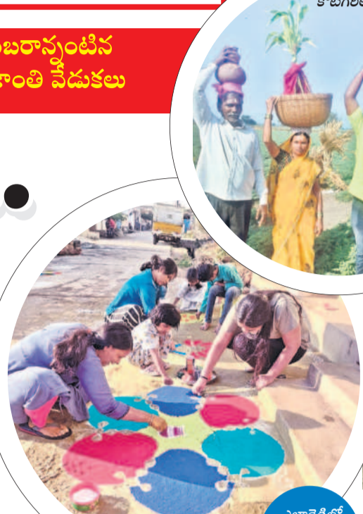
అంబరాస్తంపిన సంక్రాంతి వేడుకలు