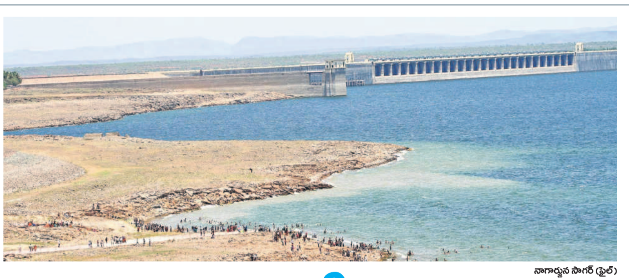
నారాయణ సాగర్ (డైట్)

కోకిల విలవిల చైనా మాంజా చుట్టుకొని.. కందుకూరు మండల పరిధిలోని జైత్యారంలో ఓ చెట్టుపై చైనా మాంజా చుట్టుకుని విలవిలలాడుతున్న కోకిలను రక్షించిన మాజీ సర్పంచ్ చర్యతారో యాదవ్ - కందుకూరు, జనవరి 17