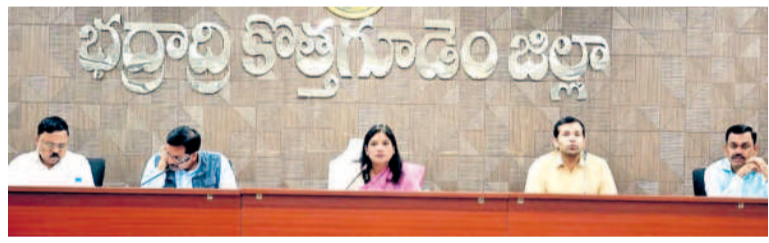
భద్రాద్రి కొత్తగూడెం జిల్లా