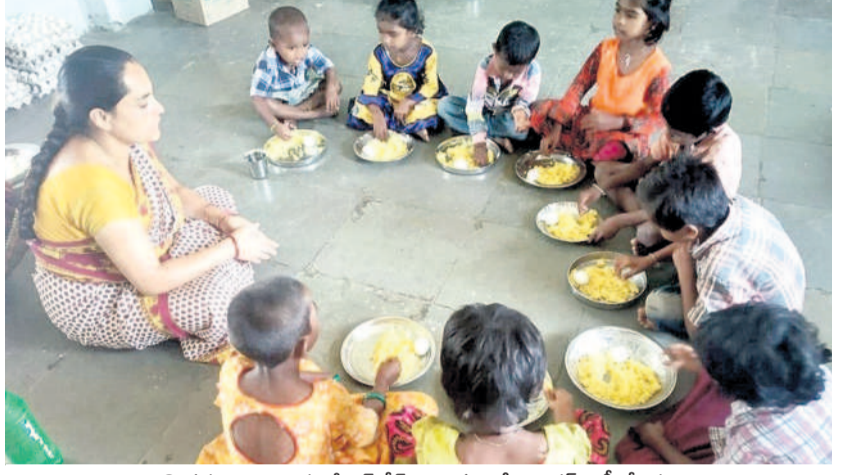
కొత్తగూడెం ప్రాజెక్టులో అవగ్రేడ్ అయిన మినీ అంగన్ వాడీ కేంద్రం

భద్రాద్రి కొత్తగూడెం, జనవరి 17 (నమస్తే తెలంగాణ) : మహిళా, శిశు సంక్షేమ శాఖ పరిధిలో నడుస్తున్న మినీ అంగన్ వాడీలు మెయిన్ అంగన్ వాడీలుగా మారాయి. దీంతో మినీ అంగన్ వాడీ టీచర్లకు గత టీచర్ లెవెల్ ప్రభుత్వంలో పురుషుల పోషకాహార.. ఎన్నికల నేపథ్యంలో అమలు కాలేదు. ప్రస్తుతం ఏర్పడిన కొత్త ప్రభుత్వంలో మెయిన్ అంగన్ వాడీలుగా మారడంతో టీచర్లకు అసందర్భ వ్యక్తిగా చేస్తున్నారు. కుటుంబాల సర్వే ఆధారంగా మార్పు ఇప్పటివరకు భద్రాద్రి కొత్తగూడెం జిల్లాలో ప్రధాన అంగన్ వాడీ కేంద్రాలు 1,434 ఉండగా.. మినీ కేంద్రాలు 626 ఉన్నాయి. మొత్తం 11 ప్రాజెక్టుల్లో అంగన్ వాడీ సేవలు పిల్లలు, బాలింతలు, తల్లిలకు అందుతున్నాయి. తక్కువ కుటుంబాలు, రెవెన్యూ గ్రామాలకు అవసరాల దురంతంగా ఉండడం కారణంగా అప్పట్లో (పదేళ్ల క్రితం) మినీ అంగన్ వాడీ కేంద్రాలను ఏర్పాటు చేశారు. అక్కడ ఉన్న తల్లిలు, పిల్లలకు ఫీడ్ బ్యాక్ తో పాటు ఇన్స్పెక్షన్ కోసం ఏర్పాటు చేసిన ఈ మినీ అంగన్ వాడీ కేంద్రాల పరిధిలో కుటుంబాలు పెరగడంతో ప్రస్తుతం సేవలు చేయడం ఇబ్బందికరంగా