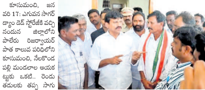
తన క్యాంప్ కార్యాలయంలో రైతులతో మాట్లాడుతున్న మంత్రి పొంగులేటి

కూసుమంచి, జనవరి 17: ఎగువన సాగర్ ద్వారా డెడ్ స్టోరేజీ వచ్చిన నందున జిల్లాలోని పాలేరు రిజర్వాయర్ పాత కాలువ పరిధిలోని కూసుమంచి, నేలకొండ పల్లి మండలాల ఆయకట్టుకు ఒకటి.. రెండు తడులకు తప్ప సాగు నీరు సరఫరా చేయలేమని రాష్ట్ర రెవెన్యూ, గృహనిర్మాణ, సమాచార శాఖల మంత్రి, పాలేరు ఎమ్మెల్యే పొంగులేటి శ్రీనివాసరావు స్పష్టం చేశారు. ఆయకట్టు రైతులు బుధవారం ఖమ్మం జిల్లా కూసుమంచి మండల కేంద్రంలోని ఎమ్మెల్యే క్యాంప్ కార్యాలయంలో మంత్రిని కలిసే సాగునీటి సమస్యలను ఆయన దృష్టికి తీసుకొచ్చారు. దీనిపై మంత్రి స్పందిస్తూ.. పంటలకు సరిపడేంత సాగుజలాల సరఫరా చేయాలని ప్రభుత్వానికి ఉండవచ్చు. ఒకవేళ నీరు ఇవ్వడానికి ఇష్టం లేకపోతే, రైతులు ఆశలు పెట్టుకుని నాట్లు పూర్తి చేస్తారని స్పష్టం చేశారు.