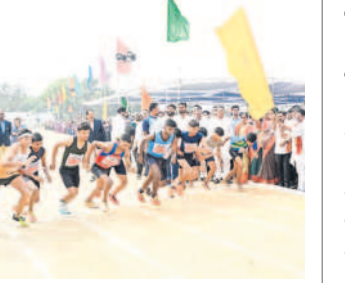
రంగంగి పోటీలో పాల్గొన్న క్రీడాకారులు