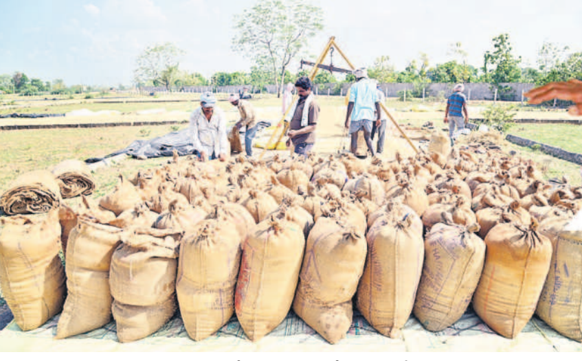
మంచిర్యాలలో ధాన్యాన్ని తూకం వేస్తున్న హామాలీలు

మంచిర్యాల, జనవరి 17(నమస్తే తెలంగాణ ప్రతినది) : కొత్తగా అధికారంలోకి వచ్చిన కాంగ్రెస్ సర్కార్ రైతులను గౌరవించేందుకు రైతుబంధు పెంచుతామని హామీ ఇచ్చి, అధికారంలోకి వచ్చాక మొండికేయి చూపుతున్నది. ఇప్పుడేమో ధాన్యం కొనుగోళ్ళు ముగిసి పది రోజులు గడిచినా.. రైతుల ఖాతాల్లో డబ్బులు జమ చేయడం లేదు. సాగు చేసేందుకు పెట్టుబడి సాయం ఇవ్వలేదు సరే.. ఆరుగంటల కప్పవడి, రెక్కలు ముక్కలు చేసుకుని పండించిన ధాన్యం డబ్బులను కూడా ఖాతాల్లో వేయకపోవడంపై రైతులు ఆగ్రహం వ్యక్తం చేస్తున్నారు. కేసీఆర్ సర్కార్ ఉన్నప్పుడు పంట కాలం వచ్చినప్పుడు చాలు దుక్కి దున్నుకునే టైమింగు రైతులకు ఇచ్చింది. ఇప్పుడేమో పంటలు వేసి నెల గడుస్తున్నా ఎకరం పొలం ఉన్న రైతుకు కూడా పెట్టుబడి సాయం అందించలేదు దుక్కి. అప్పుడేమో 24 గంటల కరెంట్ కంటే ఇప్పుడేమో 18 గంటల కరెంట్.. అప్పుడేమో ధాన్యం అమ్మిన 24 గంటల్లో రైతుల ఖాతాల్లో డబ్బులు పడితే ఇప్పుడేమో వారం, పది రోజులు అవుతున్నా పట్టించుకునే నాడుడే లేదు. కాంగ్రెస్ పార్టీ తీసుకొస్తామని చెప్పిన మార్పు ఇదేనా? అని రైతులు ప్రశ్నిస్తున్నారు.