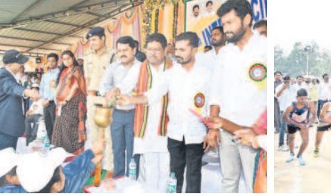
జ్యోతి ప్రజలను చేస్తున్న ఎంపీ, ఎమ్మెల్యేలు