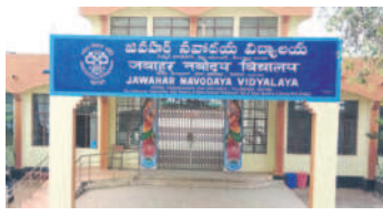
కాగజేనగర్, జనవరి 17: కాగజేనగర్ జవహర్ నవోదయ విద్యాలయంలో 2024-25 విద్యా సంవత్సరానికి ఆరో తరగతిలో ప్రవేశానికి పరీక్ష ఈ నెల 20న నిర్వహించేందుకు అధికారులు ఏర్పాట్లు పూర్తి చేశారు. ఆదిలాబాద్, నిర్మల్, మంచిర్యాల, కృష్ణా జిల్లాల టీఎస్ఆర్ కేంద్రాలలో 80 సీట్ల కోసం 4458 మంది విద్యార్థులు ఆన్లైన్ ద్వారా దరఖాస్తు చేసుకున్నారు.

కాగజేనగర్, జనవరి 17: కాగజేనగర్ జవహర్ నవోదయ విద్యాలయంలో 2024-25 విద్యా సంవత్సరానికి ఆరో తరగతిలో ప్రవేశానికి పరీక్ష ఈ నెల 20న నిర్వహించేందుకు అధికారులు ఏర్పాట్లు పూర్తి చేశారు. ఆదిలాబాద్, నిర్మల్, మంచిర్యాల, కృష్ణా జిల్లాల టీఎస్ఆర్ కేంద్రాలలో 80 సీట్ల కోసం 4458 మంది విద్యార్థులు ఆన్లైన్ ద్వారా దరఖాస్తు చేసుకున్నారు. ఆదిలాబాద్ జిల్లా నుంచి 988 మంది విద్యార్థులు దరఖాస్తు చేసుకోగా నాలుగు పరీక్షా కేంద్రాల ఏర్పాటు చేశారు. నిర్మల్ జిల్లా నుంచి 1208 మంది దరఖాస్తు చేసుకోగా, 8 కేంద్రాల్లో పరీక్ష నిర్వహించనున్నారు. మంచిర్యాల జిల్లా నుంచి 1188 మంది విద్యార్థులకు, ఏడు పరీక్షా కేంద్రాలు, కృష్ణా జిల్లా నుంచి 1079 మందికి ఐదు పరీక్షా కేంద్రాల ఏర్పాటు చేశారు. ఆయా పరీక్షా కేంద్రాల్లో ఉదయం 11.30 గంటల నుంచి మధ్యాహ్నం 1.30 గంటల వరకు ప్రవేశ పరీక్ష నిర్వహించనున్నారు.