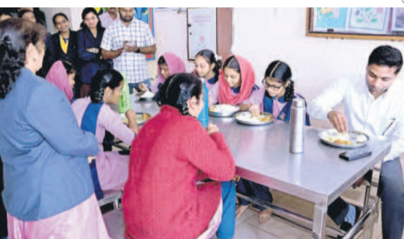
పెద్దపల్లిలోని రంగంపల్లి మైసాల్ బాలికల గురుకుల పాఠశాలలో విద్యార్థులను అత్యంత కలిసి భోజనం చేస్తున్న కలెక్టర్ ముజామ్మిల్ ఖాన్ (పై)

విద్యార్థులను ఉత్తమంగా తీర్చిదిద్దాలనే సంకల్పంతో పెద్దపల్లి కలెక్టర్ ముజామ్మిల్ ఖాన్ సరికొత్త కార్యక్రమానికి శ్రీకారం చుట్టారు. ప్రతి బుధవారం జిల్లా అధికారి ఒక పాఠశాల సందర్శనలకు అవకాశం వసతులను పరిశీలించి.. సమస్యలను పరిష్కరించే లక్ష్యంతో గత నెల 13న 'లంచ్ అండ్ లర్న్'ను ప్రారంభించారు. ఈ కార్యక్రమం సత్యతీతాలనిస్తున్నదని అధికారులు చెబుతున్నారు.