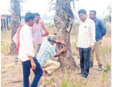
అమ్మక్కపేట శివారులో వెట్టుకు నీసీ కెమెరాలు ఏర్పాటు చేస్తున్న అలీ అధికారులు

భయాందోళనలో గ్రామస్థులు ఇట్రాంపట్టు, జనవరి 17 : ఇట్రాంపట్టు మండలం అమ్మక్కపేట శివారులోని వ్యవసాయ భూముల్లో చిరుత పులి సంచారం కలకలం రేపుతున్నది. గ్రామశివారులోని అటవీ ప్రాంతంలోపాలు వ్యవసాయ తోటలలో రెండ్రోజులుగా సంచరిస్తున్నదని గ్రామస్థులు భయపడుతున్నారు. ఈ మేరకు సమాచారం అందుకున్న ఎస్ఐఆర్ఎస్ పోకెట్ అలీ, బుధవారం గ్రామానికి చేరుకొని పాదముద్రలు పరిశీలించారు. ఏ ఇంతులో..? గుర్తించేందుకు పరిసర ప్రాంతాల్లో కలియదిద్దగా. సంచారం ఉన్న చోట సీసీ కెమెరాలు ఏర్పాటు చేశారు.