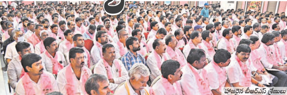
చర్యలైన బీఆర్ఎస్ శ్రేణులు

మాటగట్టుకుని ఇంటికి పోయిన కాంగ్రెస్ ప్రభుత్వాలు దేశంలో కోట్లలని విమర్శించారు. పాలమూరు-రంగారెడ్డి ప్రాజెక్టుకు జాతీయ హోదా తెస్తామని కాంగ్రెస్ మేనిఫెస్టోలో చెప్పినా, అయితే ఆ ప్రాజెక్టుకు జాతీయ హోదా ఇవ్వలేమని కేంద్రం ఇప్పటికే చేతులెత్తినట్లు తెలుస్తోంది. తెలంగాణ లోయ గానూరలో చావు వార్తను కాంగ్రెస్ నేతలు చెప్పే రోజులు ఎంతో దూరంలో లేవన్నారు. రాజకీయాలకు అతీతంగా కేసీ