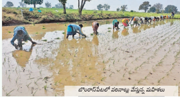
బొంబాయిలో పరిసారిత రైతులు వేస్తున్న మహిళలు

బొంబాయిలో, జనవరి 17 : జిల్లాలో యాసంగి సాగు పనులు ముమ్మరంగా కొనసాగుతున్నాయి. ఆయా పంటల సాగు ఇప్పటికే