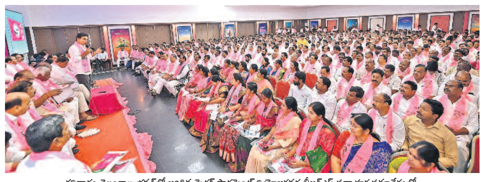
శనివారం తెలంగాణ భవన్ లో జరిగిన మెడక్ పార్లమెంట్ నియోజకవర్గ బీఆర్ఎస్ సమావేశ సమావేశంలో మూడుగురు పార్టీ వర్గం ప్రెసిడెంట్ కేటీఆర్