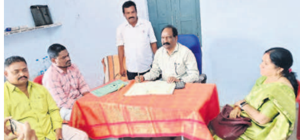
తడకమళ్ల పీఠవీధి కార్యాలయంలో అవిశ్వాస సమావేశానికి సభ్యుల కొనసాగే వేదిక హస్తానారని అధికారులు

మిర్యాలగూడ, జనవరి 19 : మండలంలోని తడకమళ్ల ప్రాథమిక సమాచార సంఘం (పీఠవీధి) చైర్మన్, వైస్ చైర్మన్లపై పెట్టిన అవిశ్వాస తీర్మానం వీగిపోయింది. దాంతో అవిశ్వాస తీర్మానం రద్దు చేస్తున్నట్లు జిల్లా అధికారి ప్రకటించారు. తడకమళ్ల పీఠవీధిలో 13 మంది సభ్యులు ఉన్నారు. అందులో 9 మంది సభ్యులు చైర్మన్, వైస్ చైర్మన్లపై అవిశ్వాసం పెట్టాలని డిసెంబర్ 20న జిల్లా అధికారికి ఫిర్యాదు చేశారు. ఆ ఫిర్యాదు మేరకు జనవరి 18న అవిశ్వాస తీర్మానానికి హాజరు కావాలని అధికారులు సభ్యులకు నోటీసులు అందజే