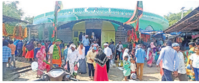
జాన్ హాడ్ దర్గా వద్ద భక్తులు

పాలకవీడు, జనవరి 19 : మండలంలోని జాన్ హాడ్ దర్గాకు శుభ్రపాఠం భక్తులు పోటీతారు. ఈ నెల 25నంది దర్గా ఉర్సు ప్రారంభం కానుండగా.. ఇప్పటి నుంచే సైదులు బాహు సమాధుల దర్గానాటి భక్తులు అధిక సంఖ్యలో హస్తానారని దర్గా ముఖా వర్ జాన్ తెలిపారు. భక్తులు పెద్ద ఎత్తున రావడంతో దర్గా పరిసరాలు కిక్కిరిశాయి.