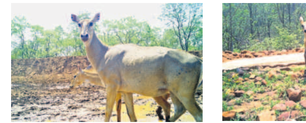
నల్లమల అటవీ ప్రాంతంలో సంపదాస్థులు అటవీ జంతువులు

మిర్యాలగూడ, జనవరి 19 : మండలంలోని తడకమళ్ల ప్రాథమిక సమాచార సంఘం (పీఠవీధి) చైర్మన్, వైస్ చైర్మన్లపై పెట్టిన అవిశ్వాస తీర్మానం వీగిపోయింది. దాంతో అవిశ్వాస తీర్మానం రద్దు చేస్తున్నట్లు జిల్లా అధికారి ప్రకటించారు. తడకమళ్ల పీఠవీధిలో 13 మంది సభ్యులు ఉన్నారు. అందులో 9 మంది సభ్యులు చైర్మన్, వైస్ చైర్మన్లపై అవిశ్వాసం పెట్టాలని డిసెంబర్ 20న జిల్లా అధికారికి ఫిర్యాదు చేశారు. ఆ ఫిర్యాదు మేరకు జనవరి 18న అవిశ్వాస తీర్మానానికి హాజరు కావాలని అధికారులు సభ్యులకు నోటీసులు అందజే