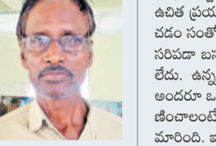
యూదవెడ్డి అద్దె బస్ డ్రైవర్, దుబ్బాక డిపో

రెండు నెలల నుంచి బస్ నడవడం చాలా కష్టంగా మారింది. మహాల్క్షి పథకం ద్వారా మహిళలకు ఉచితంగా ప్రయాణం కల్పించడంతో మహిళా ప్రయాణికులు భారీ సంఖ్యలో ప్రయాణిస్తున్నారు. నేను దుబ్బాక-సికింద్రాబాద్ రూట్లో బస్ నడుపుతాను. ఆ రూట్లో చాలా గ్రామాలనుండి ప్రతి రోజు బస్ నిలుపాలి. ప్రయాణికులతో ఎంత శాంతంగా మాట్లాడినా ఫలితం ఉండడం లేదు. నేను వెంటనే కాంట్రాక్టులోకి కూడా మహిళలు వచ్చి నిలబడి ప్రయాణిస్తున్నారు. మాకు పని భారం అధికమవడంతో ఆరోగ్య సమస్యలు వస్తున్నాయి.