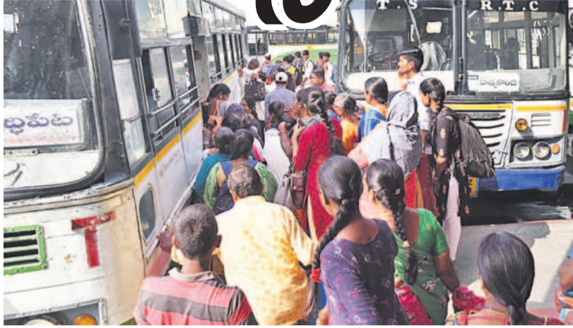
శుక్రవారం సిద్ధిపేట మోడర్న్ బస్ డిపోలో బస్సులు ఎక్కేందుకు ప్రయాణికుల ఇక్కట్లు

సిద్ధిపేట, జనవరి 19: ఆర్టీసీ బస్సులు సమయానికి రాకపోవడంతో ప్రయాణి