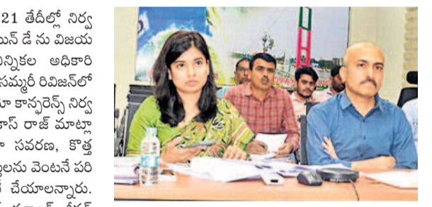
వీసీలో పాల్గొన్న కలెక్టర్, అదనపు కలెక్టర్, అధికారులు