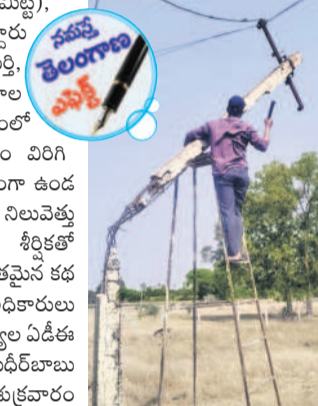
విరిగిన స్తంభాన్ని తొలిగిస్తున్న సిబ్బంది