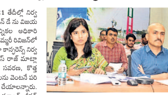
వీసీలో పాల్గొన్న కలెక్టర్, అదనపు కలెక్టర్, అధికారులు