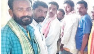
వైద్య పరీక్షల కోసం క్యూలైన్లో వేచివున్న హమాలీ కార్మికులు