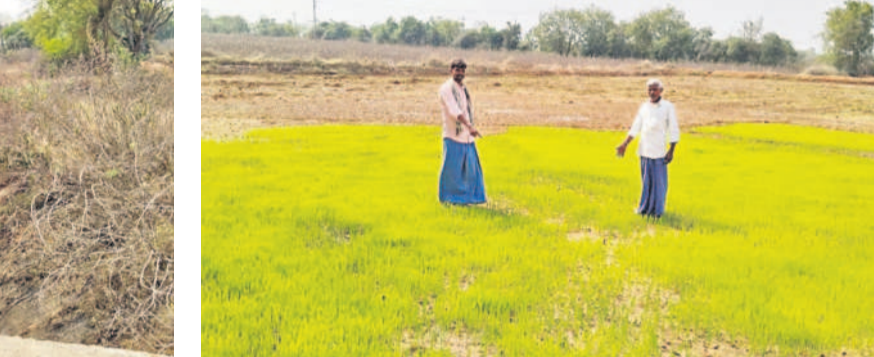
మద్దూరులో ఎండిపోతున్న నారుమడిని చూపుతున్న రైతులు