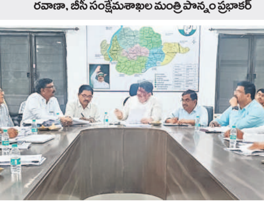
సమీక్షా సమావేశంలో మాట్లాడుతున్న మంత్రి పాస్కం ప్రభాకర్