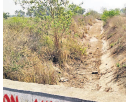
రిజర్వాయర్ ప్రధాన కార్య దుస్థితి

గోల్ రైతులు సాగు పనులు మొదలు పెట్టారు. అయితే రిజర్వాయర్లోకి అధికారులు గోదావరి జలాలను విడుదల చేయకపోవడంతో రిజర్వాయర్ నుంచి నీటి విడుదలను నిలిపివేశారు. దీంతో నీరు లేక పొలాలు బీటలు పారుతున్నాయి. నాట్ల వేసిన వర నారు ఎండిపోతున్నాయి. నాటు వేసినందుకు సిద్ధంగా ఉన్న నారు కూడా ఎండిపోతుంది.