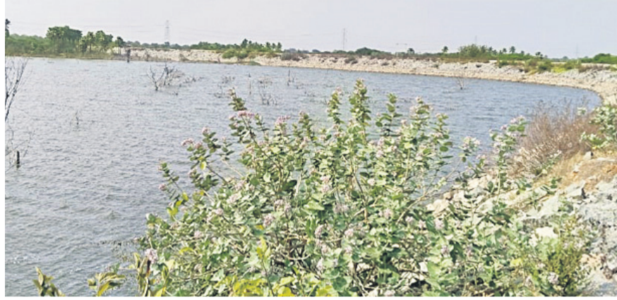
నీటి మట్టం తగ్గిన లద్దూర్ రిజర్వాయర్

మద్దూరు (ధూళిమట్ట), జనవరి 20 : ఏడాదంతా నిండుకుండలా ఉండే రిజర్వాయర్లో నీటిమట్టం తగ్గింది. నిన్నుమొన్నటి వరకు గోదావరి జలాలతో సమృద్ధి చేసిన ఆ కార్య ఎండిపోయి ఎక్కడికక్కడైంది. ఎప్పటి మాదిరిగానే కార్య ద్వారా నీరుండుతుందని కోటి ఆశలతో సాగు పనులు మొదలు పెట్టిన రైతులను ఆదిలోనే అరిగోసడతున్న పరిస్థితులు ప్రస్తుతం మద్దూరు మండలంలో నెలకొన్నాయి. మండలంలోని లద్దూర్ రిజర్వాయర్ కొన్నేండ్లగా గోదావరి జలాలతో కళకళలాడింది. ప్రస్తుతం రిజర్వాయర్లో నీటి మట్టం సగంనీటిగా తగ్గింది. దీంతో రిజర్వాయర్ నుంచి ప్రధాన కార్యలోకి నీటి విడుదలను నిలిపివేశారు. కార్య నీటిని సమృద్ధిగా లద్దూర్, మర్నాముల, ధర్మారం, మద్దూరు గ్రామాల్లో వంద ఎకరాలకు పైగా రైతులు పంటలను సాగుచేస్తున్నారు. ఎప్పటి మాదిరిగానే ఈ యాసం