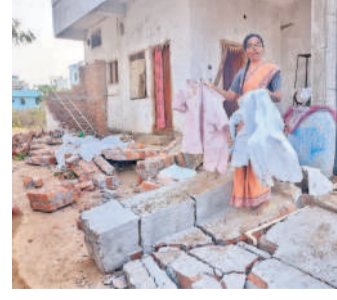
సిద్ధిపేటలో కూల్చిన ప్రసాదీ