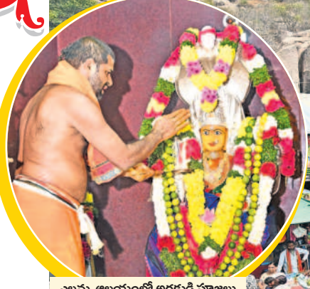
ఎల్లమ్మ ఆలయంలో అర్చకుడి పూజలు

కోటి దండాలయ్యా.. కోరమసాలయ్య మల్లన్న దర్శనంతో పులకించిన భక్తజనం తొలిరోజు 75వేల మంది భక్తుల రాక నేడు కొమురవెల్లి క్షేత్రంలో పెద్ద పట్టుం, అగ్నిగుండం