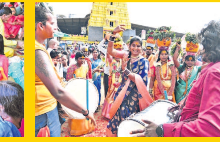
బోనాలతో శివసత్తుల పూసకాలు, నృత్యం చేస్తున్న మహిళా భక్తులు