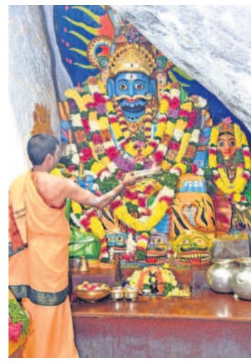
మల్లికార్జున స్వామి వారి ఆలయంలో అర్చకుడి పూజలు

గజ్జెల లాగులు.. డమరుక నాదాలు.. డోలు చప్పుళ్లు.. అర్చకుల పూజలు.. ఒగ్గ పూజారుల పట్నాలు.. పోతరాజుల విన్యాసాలు.. మహిళల బోనాల సమర్పణతో సిద్దిపేట జిల్లాలోని కొమురవెల్లి మల్లన్న క్షేత్రం పులకించిపోయింది. ఆదివారం పట్టు వారంతో క్షేత్రంలో బ్రహ్మాత్మవాయి వ్రారంభమయ్యాయి. స్వామివారి దర్శనానికి భక్తులు పోటిపెట్టారు. మల్లన్న నామస్మరణతో క్షేత్రం పరవశించింది.