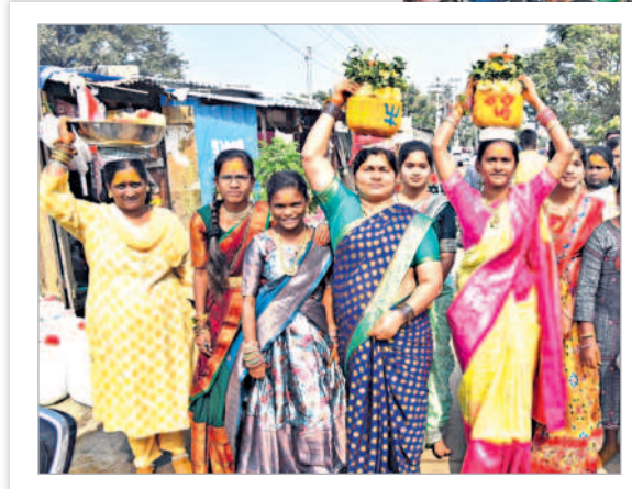
కుటుంబ సభ్యులతో బోనం తీసుకుపోతున్న మహిళలు