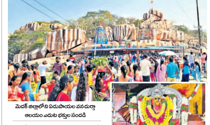
మెదక్ జిల్లాలోని ఏడుపాయల వనదుర్గా ఆలయం ఎదుట భక్తుల సందడి