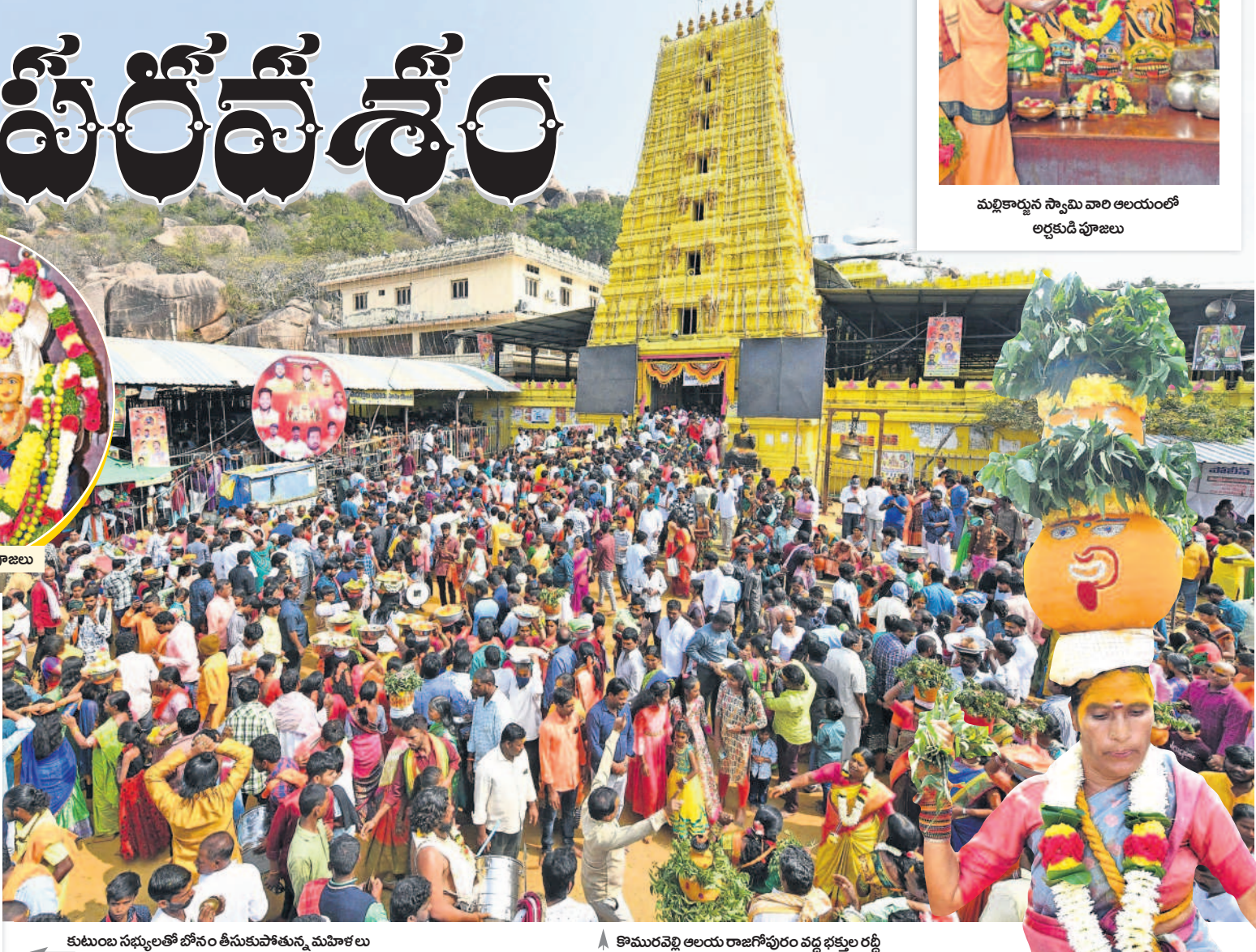
కొమురవెల్లి ఆలయ రాజగోపురం వద్ద భక్తుల రద్దీ