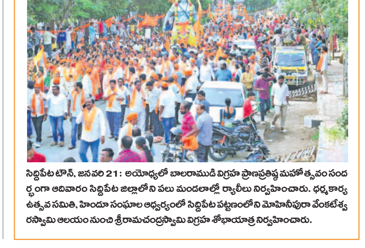
సిద్దిపేట టౌన్, జనవరి 21: అయ్యాగోటి బాలరామమడి విగ్రహ ప్రాంతాల్లో మహాత్మ్యం సందర్భంగా ఆదివారం సిద్దిపేట జిల్లాలోని పలు మండలాల్లో ర్యాపిడు నిర్వహించారు. ధర్మకార్య ఉత్సవ సమితి, హిందూ సంఘాల ఆధ్వర్యంలో సిద్దిపేట పట్టణంలోని మోహనీపురా వేంకటేశ్వరస్వామి ఆలయం నుంచి శ్రీరామచంద్రస్వామి విగ్రహ శోభాయాత్ర నిర్వహించారు.