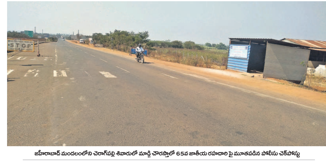
జహీరాబాద్ మండలంలోని చెరాగపల్లి శివారులో మ్యాడ్లీ ఛౌరస్తాలో 65వ జాతీయ రహదారి పై మూతపడిన పోలీసు చెక్పోస్టు

మద్దూరు (మాళిమిట్ల), జనవరి 21: సిద్దిపేట జిల్లా మద్దూరు మండలం లద్దూర్ రిజర్వాయర్లోకి గోదావరి జలాలు విడుదల చేయలేదు. నీటిమట్టం తగ్గడం, ప్రధాన కాల్వ ఎండిపోతున్న వైవాన్వి ఆదివారం సమస్య తెలంగాణ దినపత్రికలో 'గోదావరి జలాలు కోసం ఎదురు చూపు' అనే కథనం ప్రచురితమైంది. స్పందించిన దేవదూల అధికారులు ఆదివారం రిజర్వాయర్లోకి గోదావరి జలా