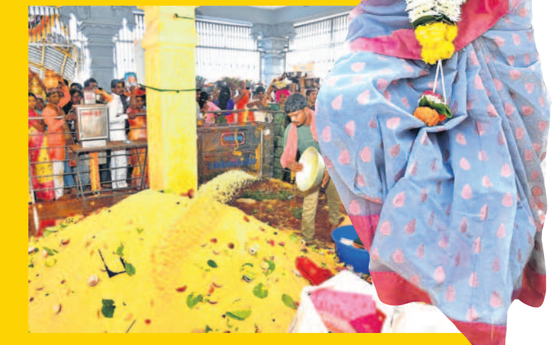
ఎల్లమ్మకు భక్తులు సమర్పించిన ఒడి బియ్యం