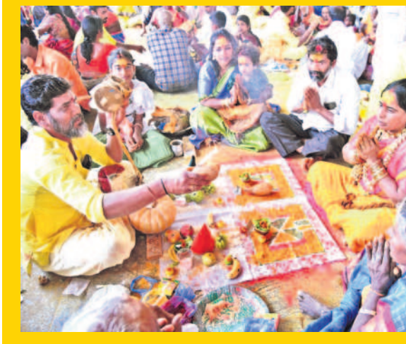
ఒగ్గ పూజారిలో పట్టుం వేయించి మొక్కు చెల్లించుకుంటున్న భక్తులు