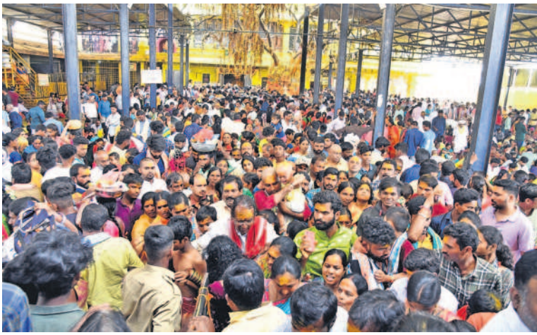
కొమురవెల్లి మల్లన్న ఆలయ గంగేరు చెట్టు వద్ద భక్తుల రద్దీ