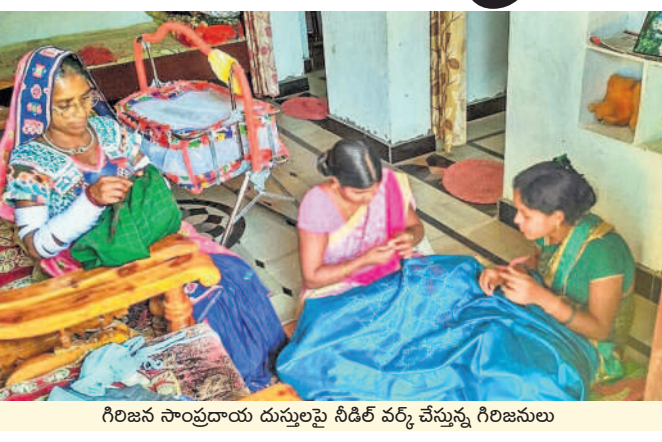
గిరిజన సాంప్రదాయ దుస్తులపై సీడీలె వర్క్ చేస్తున్న గిరిజనులు

దుస్తులను మార్కెట్లో విక్రయించడానికి కూడా సదుపాయాలను కల్పించడంతో ప్రతి ఒక్కరూ ఈ హస్తకళ వృత్తిని ఎంచుకున్నారు. సంస్కృతి, సాంప్రదాయాలను ఉద్ధరించే తయారు చేసే వస్త్రాలకు మంచి డిమాండ్ ఉండడంతో రాష్ట్ర స్థాయి నుంచి జాతీయ స్థాయికి ఎల్లమ్మతండాకు మంచి గుర్తింపు లభించింది. వీరు తయారు చేసిన వస్త్రాలను నాంపల్లిలోని ఎగ్జిబిట్ గ్రౌండ్ లో కూడా ప్రదర్శిస్తున్నారు. వేరే దేశాల్లో కూడా వస్త్ర ప్రదర్శనలు చేస్తున్నారు.