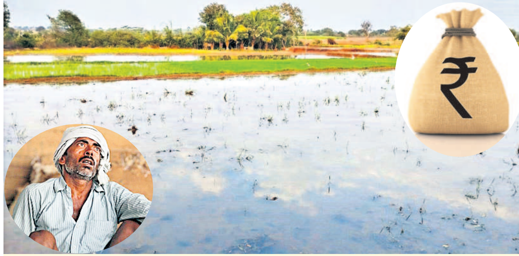
షాబాద్ మండలం కుమ్మరిగూడలో వరిసాగు సాధించే సందర్భంలో

మండిపడుతున్నారని. కేసీఆర్ ఇచ్చే రైతు బంధు కాకుండా రైతు భరోసా పథకం ద్వారా ఎకరాలకు రూ.15వేలు అందిస్తామని చెప్పిన కాంగ్రెస్ ప్రభుత్వం ఇప్పటివరకు అది, ఇది ఏదీ ఇవ్వకుండా రైతులను ఇబ్బందులకు గురి చేస్తున్నది.