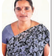
-నసావతి వద్ద, సర్కార్

గిరిజనులు తయారు చేసిన వస్త్రాలకు మార్కెట్లో మంచి డిమాండ్ ఉన్నది. మేము సీడీలె వర్క్ ప్రారంభించినప్పటికీ.. మా వద్ద డబ్బులు లేకపోయేది. వైఎస్ఆర్ వ్యక్తులు ఇచ్చిన వస్త్రాలపై సీడీలె వర్క్ చేసిన వివిధ రకాల డిజైన్లను మేము తప్పక ధరకే విక్రయించేవాళ్ళం. గత ప్రభుత్వం హస్తకళలకు పెద్దపీట వేయడంతో మేము తయారు చేసిన వస్త్రాలను నేరుగా నగరంలోని వివిధ ప్రాంతాల్లో అమ్ముకోవడానికి ప్రభుత్వం ప్రోత్సహించింది. నేడు ఎల్లమ్మతండాలో ప్రతి ఒక్కరూ నిత్యం వీటిని తయారు చేయడంలో పోటీపడుతున్నారు.