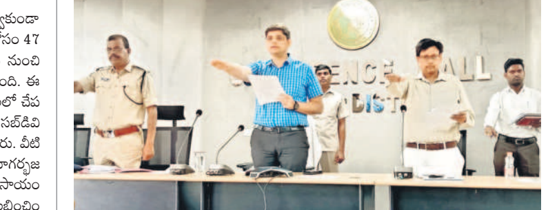
ప్రతిష్ఠ చేస్తున్న కలెక్టర్, అధికారులు