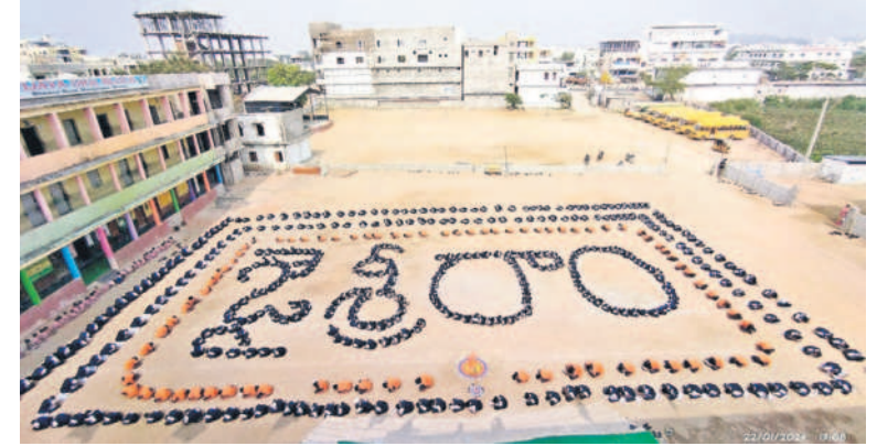
నిర్మల్ అర్బన్ : జై శ్రీరాం అక్షర క్రమంలో విద్యార్థులు