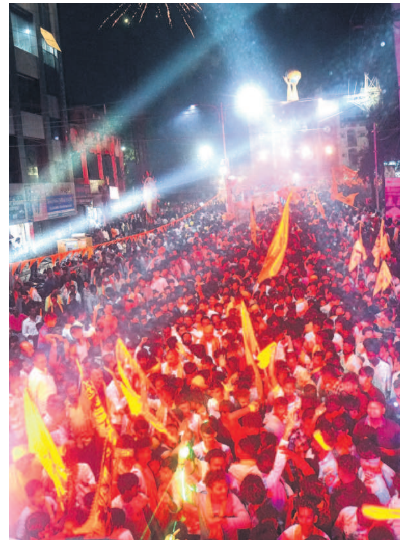
ఆదిలాబాద్ జిల్లాకేంద్రంలోని వినాయక చాకి వద్ద శోభాయాత్రలో పాల్గొన్న భక్తులు