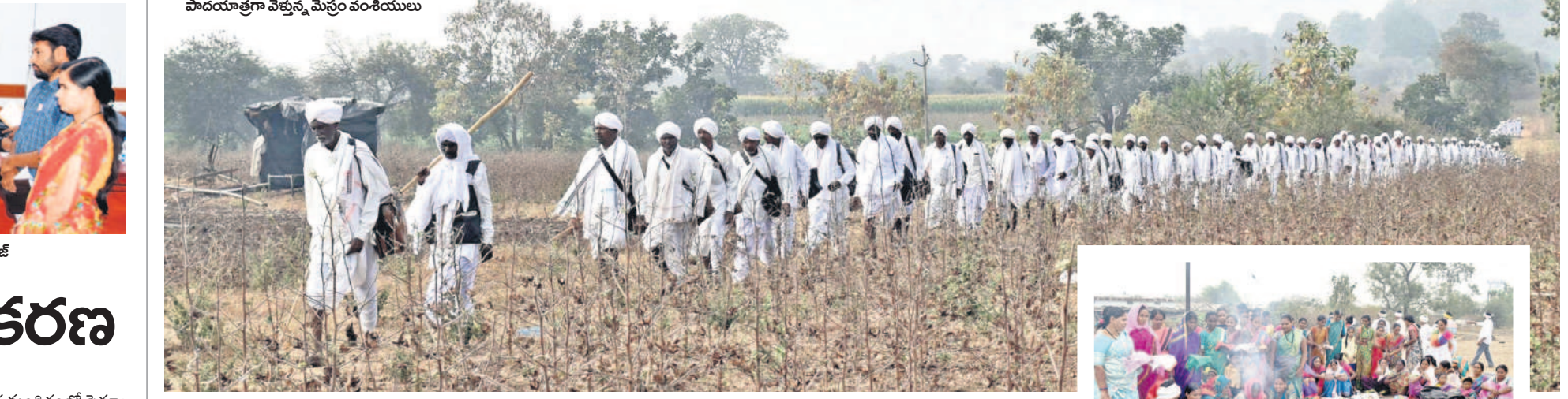
పాదయాత్రగా వెళ్తున్న మేఘం వంశీయులు