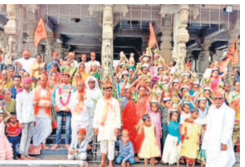
ఇంద్రవెల్లి : నాగోబా ఆలయంలో అక్షింతలతో ఆదివాసులు