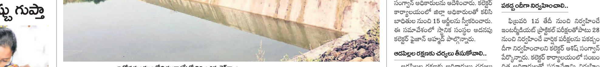
ఇచ్చోడ మండలంలోని ముతా(కే)లో నిర్వహించిన చెక్ డ్యాం