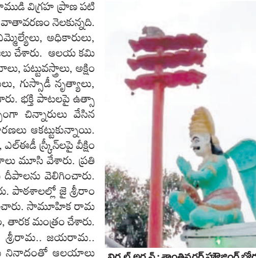
నిర్మల్ అర్బన్ : శాంతినగర్ హాజింగ్ బోర్డు కాలనీలోని రామాలయంలో ధ్వజస్తంభాన్ని ఊపుతున్న వానరం

సమస్య నెట్వర్క్ : అయోధ్యలో బాల రాముడి విగ్రహ ప్రాణ ప్రతిష్ఠతో సోమవారం పల్లె, పట్టణాల్లో పండుగ వాతావరణం నెలకున్నది. రామాలయం, హనుమాన్ ఆలయాల్లో ఎమ్మెల్యేలు, అధికారులు, ప్రజాప్రతినిధులు యజ్ఞాలు, ప్రత్యేక పూజలు చేశారు. ఆలయ కమిటీల ఆధ్వర్యంలో శ్రీ సీతారాముల చిత్రపటాలు, పట్టువస్త్రాలు, ఆక్షింతలతో బ్యాండ్ మేళాలు, మంగళహారతులు, గున్నాడి నృత్యాలు, కేలాటాల మధ్య శోభాయాత్ర నిర్వహించారు. భక్తి పాటలపై ఉత్సాహంగా నృత్యాలు చేశారు. ఈ సందర్భంగా చిన్నారులు వేసిన రాముడు, లక్ష్మణుడు, సీత, శబరి వేషధారణలు ఆకట్టుకున్నాయి. ప్రజలు ప్రాణ ప్రతిష్ఠ కార్యక్రమాన్ని టీవీలు, ఎల్ఈడీ స్ట్రీన్లపై వీక్షించారు. వ్యాపారులు స్వచ్ఛందంగా దుకాణాలు మూసివేశారు. ప్రతి ఇంటి ముంగిట మహిళలు ముగ్గులు వేసి దీపాలను వెలిగించారు. ఇంటిపై శ్రీరాముని జెండాను ఎగర వేశారు. పాలకాలలో జై శ్రీరాం ఆకారంలో విద్యార్థులు ప్రదర్శన నిర్వహించారు. సామాజిక రామ భజనలు, హనుమాన్ దాలీసా పారాయణం, తారక మంత్రం చేశారు. కొన్నిచోట్ల ఖైక్ ర్యాలీలు నిర్వహించారు. శ్రీరామ.. జయరామ.. జయజయ రామ.. హరేరామ హరేరామ నినాదంతో ఆలయాలు మారుమోగాయి. చిన్న పిల్లలు మొదలుకొని పండు ముదుసలి వరకు యువతీయువకులు, మహిళలు రామదండగా కదిలారు.