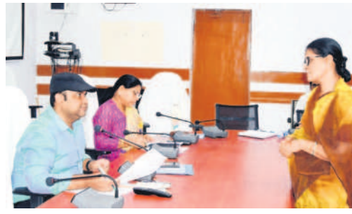
అర్జీలను స్వీకరిస్తున్న ఆదిలాబాద్ కలెక్టర్ రావూరి రాజ్