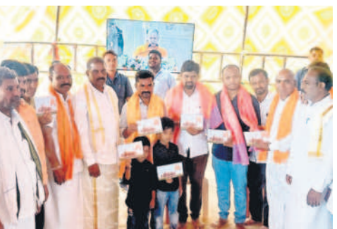
ఉట్టూర్ : ఎమ్మెల్యేను సన్మానిస్తున్న హిందూ సంఘాల నాయకులు