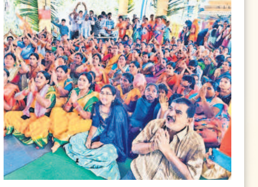
ఏటూరునాగారంలో శ్రీరాముడి ప్రాణ ప్రతిష్ఠను వీక్షిస్తున్న భక్తులు