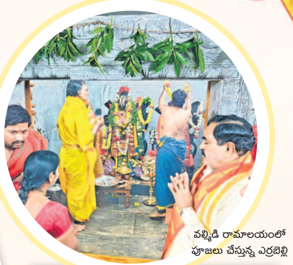
నల్గొండ రామాలయంలో పూజలు చేస్తున్న ఎర్రబిల్లి

రామ నామస్మరణతో మార్చేగిన ఆలయాలు పలుచోట్ల బాలరాముడి ప్రాణప్రతిష్ఠ లైవ్ అపురూప ఘట్టాన్ని కనులారా వీక్షించి తరించిన భక్తజనం ఊరూరా ఉత్సవ విగ్రహాలు, చిత్రపటాలతో శోభాయాత్ర భక్తిపారవశ్యంలో మునిగిపోయిన జనం