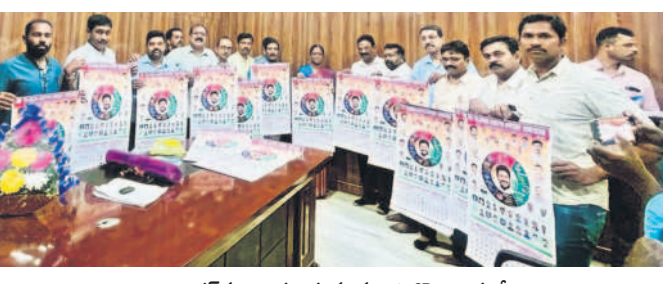
క్యాబినెట్ ను అవిష్కరిస్తున్న మంత్రి కొండా సురేఖ