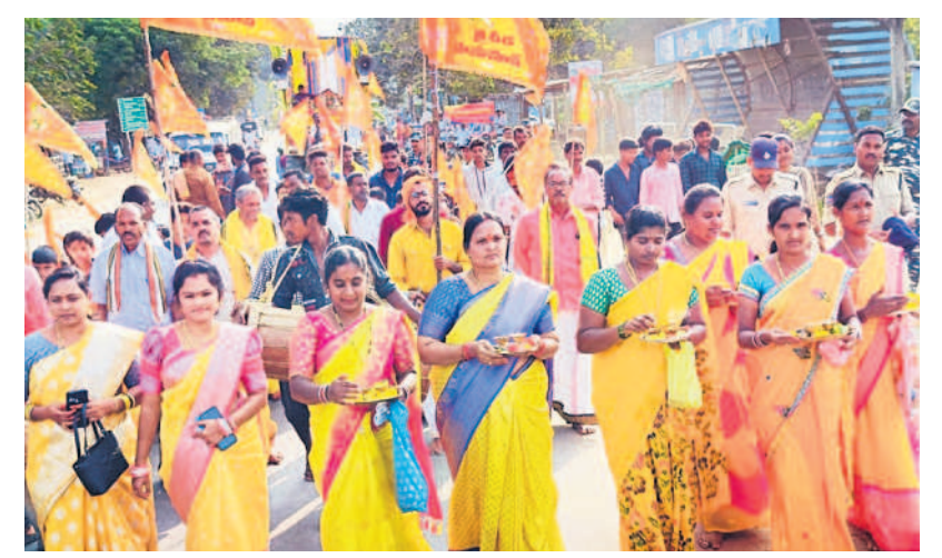
ఏటూరునాగారంలో ర్యాలీగా వస్తున్న భక్తులు