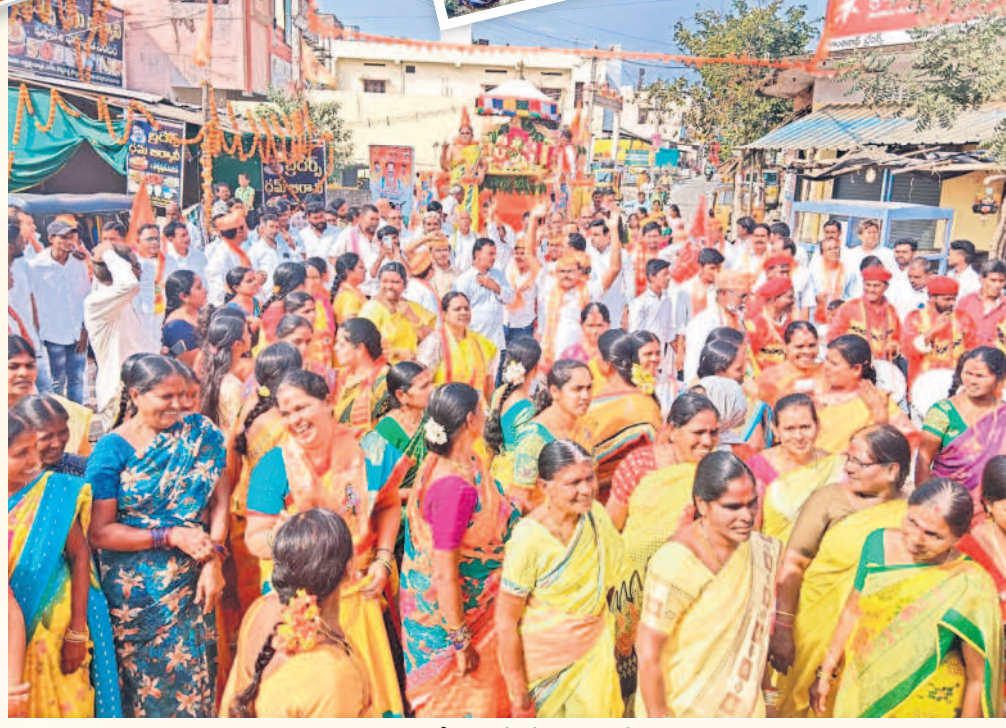
గార్ల మండల కేంద్రంలో శోభాయాత్రలో భక్తులు