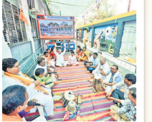
కాశీబగ్గలోని శ్రీకాశీవిశ్వేశ్వర స్వామి దేవాలయంలో శ్రీరామజనం చేస్తున్న భక్తులు