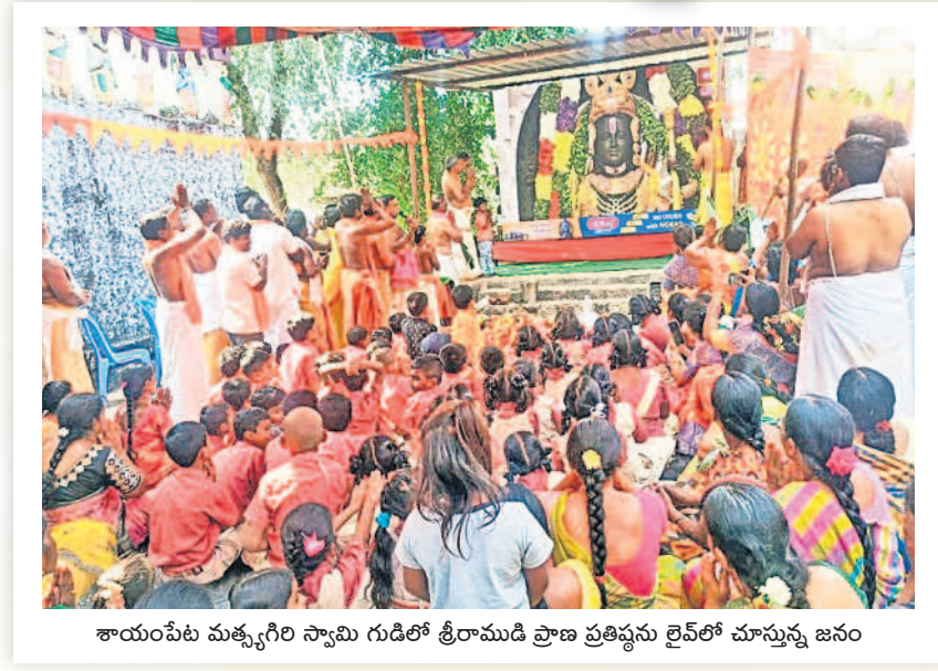
శాయంపేట మత్స్యగిరి స్వామి గుడిలో శ్రీరాముడి ప్రాణ ప్రతిష్ఠను లైవ్లో చూస్తున్న జనం