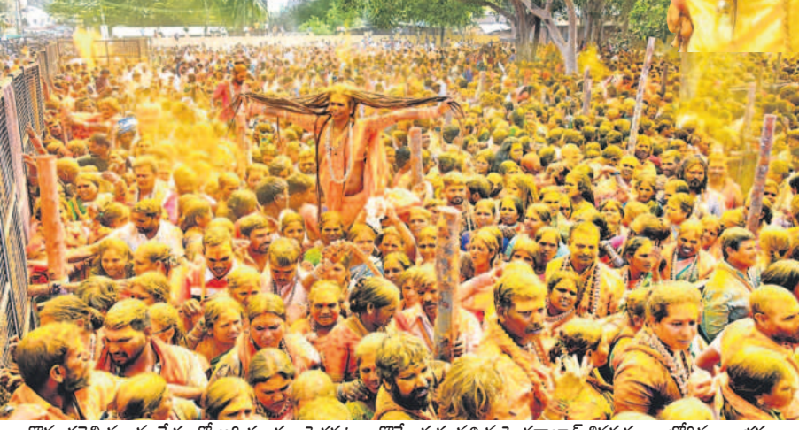
కొమరవెల్లి మల్లన్న క్షేత్రంలో అగ్నిగుండం, పెద్దపట్నం తోత్కేయకు వచ్చిన హైదరాబాద్ శివసత్తులు, జోగిగులు, భక్తులు