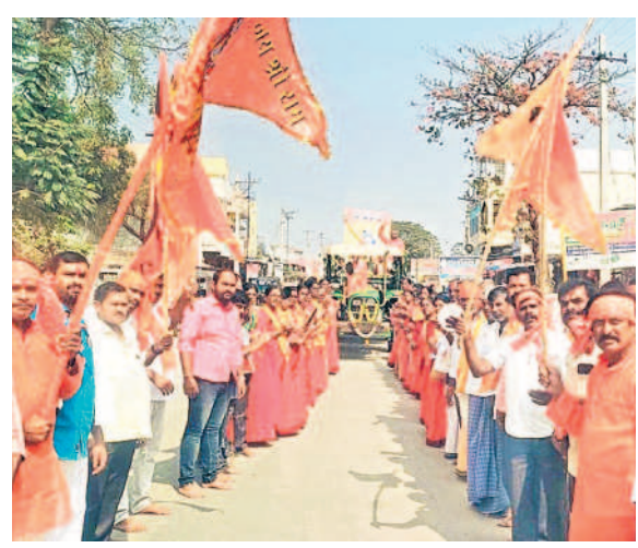
నర్సేపేటలో శ్రీరాముడి శోభాయాత్రలో పాల్గొన్న భక్తులు