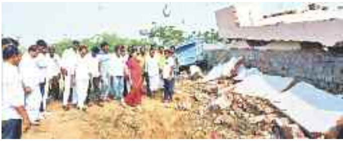
మల్లాపూర్లో కూల్చిన యువజన సంఘం భవనాన్ని పరిశీలిస్తున్న మాజీ ఎమ్మెల్యే గొంగిడి సునీతామహేందర్ రెడ్డి