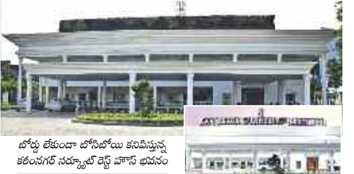
బోర్డు లేకుండా బోసీబోయ్ కనిపిస్తున్న కరీంనగర్ సర్కూల్ రెస్టో హౌస్ భవనం

లండన్, జనవరి 22: ఇషా తుఫానుతో బ్రిటన్, ఐర్లాండ్ అతలాకుతలమవుతున్నాయి. గంటకు 160 కిలోమీటర్ల వేగంతో వీస్తున్న గాలులకు చెట్లు అమాంతం కూలుతున్నాయి. ఫలితంగా లక్షలాది ఇండ్లకు విద్యుత్తు సరఫరా నిలిచిపోయింది. సోమవారం వందలాది రైల్వే రద్దయ్యాయి. భారీ వర్షానికి తోడు