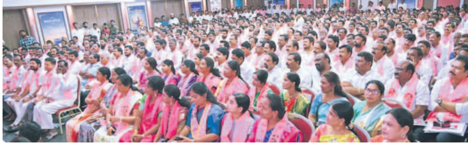
సమావేశానికి హాజరైన ప్రజాప్రతినిధులు బీఆర్ఎస్ నాయకులు నాయకులు, కార్యకర్తలు

కోమటిరెడ్డి ఇంటికి కరెంటు బిల్లులు పంపాలి ఎన్నికల ప్రచారంలో కోమటిరెడ్డి వెంకటరెడ్డి నవంబర్ నెల నుంచే కరెంటు బిల్లులు కట్టవద్దని ప్రజలకు చెప్పారని గుర్తు చేస్తూ నల్లగొండ ప్రజలంతా తమ బిల్లులను కోమటిరెడ్డి ఇంటికి పంపాలని చెప్పారు. కాంగ్రెస్ నేతల హామీలపై ఎప్పటికప్పుడు ప్రజల్లోకి వెళ్తున్న సూచనలు మానవ రాజకీయాలను, ఓటమికి అనేక కారణాలు ఉన్నాయంటూ పార్టీకి, ప్రభుత్వానికి మరింత సమస్య అవ్వకుండా అవసరమన్న భావనతో కార్యకర్తలకు ఉన్నట్లు వ్యాఖ్యానించారు. సోషల్ మీడియాలో