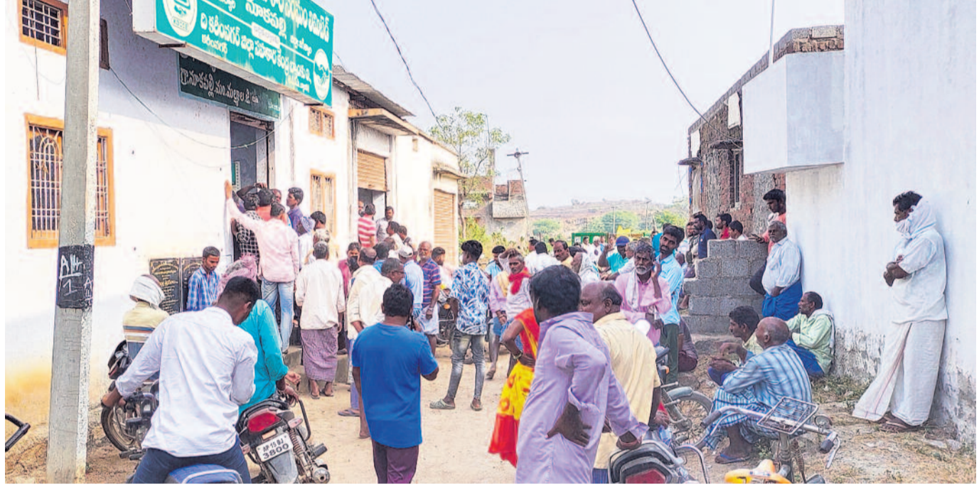
జగిత్యాల జిల్లా మల్కాల మండలం నూకపల్లి ప్రాథమిక సహకార సంఘం వద్ద మంగళవారం ఉదయం నుంచే రైతులు యూరియా కోసం వడిగావులు వడ్డారు. ఎదురుపల సరఫరా తీవ్రమైనా ఉన్నందున తలా 2 బస్తాల యూరియా మాత్రమే ఇస్తామనడంతో సుమారు 200మంది రైతులు గంటల తరబడి వేచి చూశారు.

గంటల తరబడి క్యూలో నిలిచిస్తున్న రైతులు.. ఒక్కొక్కరికి రెండు బస్తాలే లిమిట్