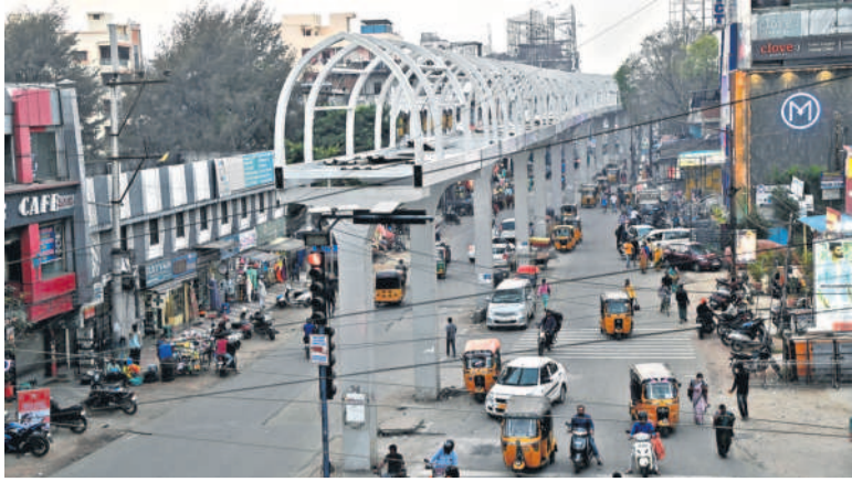
మెహిదీపట్నం రైతుబజార్ వద్ద నిర్మాణంలో ఉన్న స్ట్రీట్ లైటింగ్