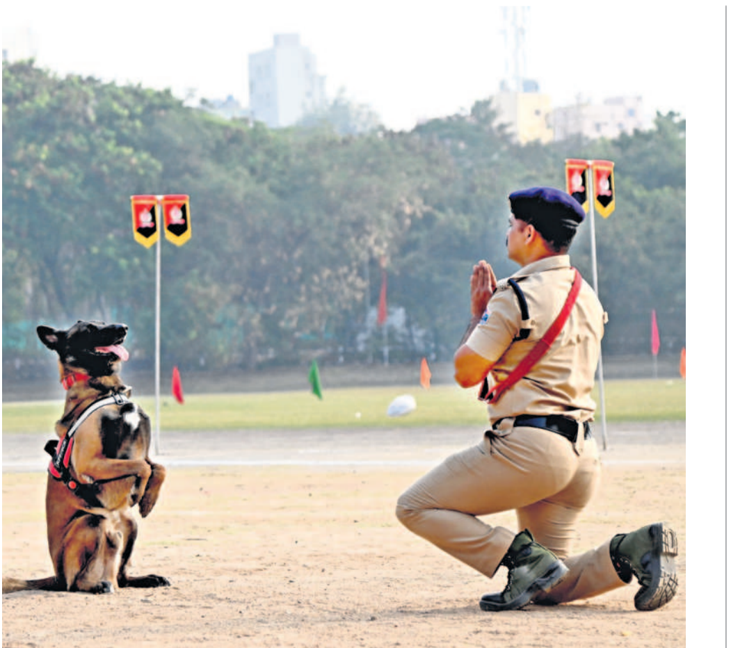
పోలీసు లహార్స్ గణతంత్ర దినోత్సవాన్ని పురస్కరించుకొని సికింద్రాబాద్ లోని ఆల్ అరబ్స్ గ్రౌండ్ లో లహార్స్ చేస్తున్న పోలీసులు, డాగ్ డాన్స్

ఉస్మానియా యూనివర్సిటీ, జనవరి 24 : ఉస్మానియా యూనివర్సిటీ ఫిజికల్ ఎడ్యుకేషన్ కళాశాల లో పార్టీ టైం లెక్కర నియామకాల్లో జరిగిన అవినీతిపై విద్యార్థులు ఆందోళన చేస్తున్నారు. ఉస్మానియా యూనివర్సిటీ, జనవరి 24 : ఉస్మానియా యూనివర్సిటీ ఫిజికల్ ఎడ్యుకేషన్ కళాశాల లో పార్టీ టైం లెక్కర నియామకాల్లో జరిగిన అవినీతిపై విద్యార్థులు ఆందోళన చేస్తున్నారు. ఉస్మానియా యూనివర్సిటీ, జనవరి 24 : ఉస్మానియా యూనివర్సిటీ ఫిజికల్ ఎడ్యుకేషన్ కళాశాల లో పార్టీ టైం లెక్కర నియామకాల్లో జరిగిన అవినీతిపై విద్యార్థులు ఆందోళన చేస్తున్నారు. ఉస్మానియా యూనివర్సిటీ, జనవరి 24 : ఉస్మానియా యూనివర్సిటీ ఫిజికల్ ఎడ్యుకేషన్ కళాశాల లో పార్టీ టైం లెక్కర నియామకాల్లో జరిగిన అవినీతిపై విద్యార్థులు ఆందోళన చేస్తున్నారు.