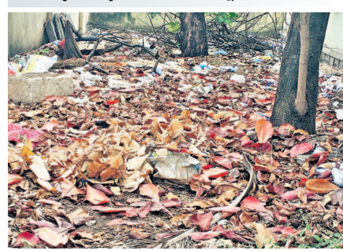
సరూర్నగర్ సబ్ రిజిస్టార్, ఐసీడీఎస్ కార్యాలయాల చుట్నా పేరుకుపోయిన చెత్త