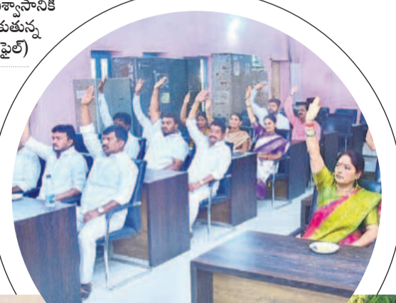
చైర్మన్ పదవి ఎన్నికను సాధించిన మున్సిపల్ చైర్మన్లు కౌన్సిలర్లు (పైట)