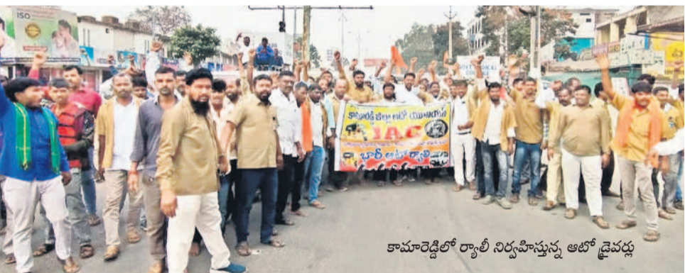
కామారెడ్డిలో ర్యాలీ నిర్వహిస్తున్న ఆటో డ్రైవర్లు