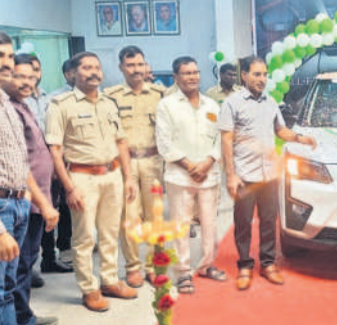
డివీపల్లె సమీపంలోని మహిళా షోరూంలో ఎన్ఫోర్స్ మెంట్ - 400 ఎలక్ట్రిక్ కారును డీవీపల్ వెంటకర్తలకు, జీవీఎస్ సూపరింటెండెంట్ డాక్టర్ ప్రతిపాదాజ్, కంపెనీ ఏరియా సెల్ఫ్ మేనేజర్ వంటి బుధవారం అభివృద్ధిచేశారు. - ఖలీల్ వాడీ, జనవరి 24