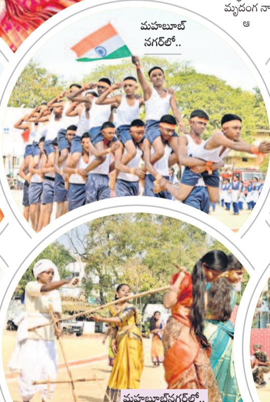
మహబూబ్ నగర్ లో..