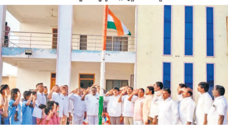
ఉండవెల్లి మండలంలోని క్యాంప కార్యాలయంలో జాతీయ జెండాకు సెల్యూట్ చేస్తున్న అలంపూర్ ఎమ్మెల్యే విజయము