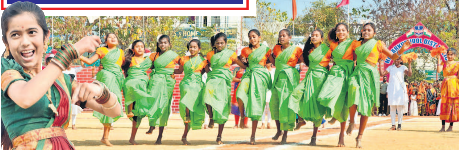
నాగర్ కర్నూల్ జిల్లా కేంద్రంలో చిన్నారల నృత్య ప్రదర్శన