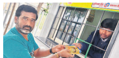
బ్రేక్ దర్శనం భక్తులకు శ్రీలహరి గ్రంథాన్ని అందిస్తున్న అలయ సిబ్బంది