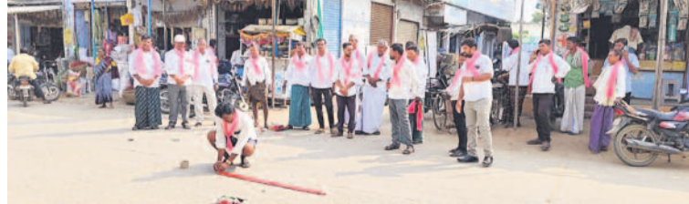
నాగర్ కర్నూల్ జిల్లా పెంట్లవెల్లిలో పటాకులు కార్మికులు చేసుకుంటున్న బీఆర్ఎస్ శ్రేణులు

నమస్తే తెలంగాణ నెట్వర్క్, జనవరి 27: ప్రజా స్వామ్యాన్ని అపహసనం చేస్తూ అధికార పార్టీ చేస్తున్న కుట్రలను ప్రతిష్ట బీఆర్ఎస్ సమగ్రంగా అడ్డు పాటు చేస్తున్నామని కోరారు. హైదరాబాద్ పర్యటనకు వచ్చిన చైర్మన్లను హరిత షాతాల్లో శనివారం ప్రత్యేకంగా కలిపి చర్చించారు. జనగణనతో పాటు ఓబీసీ కులగణన చేపట్టేలా కోర్టానికి సీపీఐఐను చేయాలని విజ్ఞప్తి చేశారు. కులగణనతోనే సామాజిక న్యాయం, అసమానతలు లేని సమాజం సాధ్యమని పేర్కొన్నారు. బలహీనవర్గాల సమస్యలు, బీసీల కొరతం చేపట్టాలని సంక్షేమ పథకాలు, ఓబీసీ రిజర్వేషన్ల తదితర అంశాలపై ఆయనతో చర్చించారు.