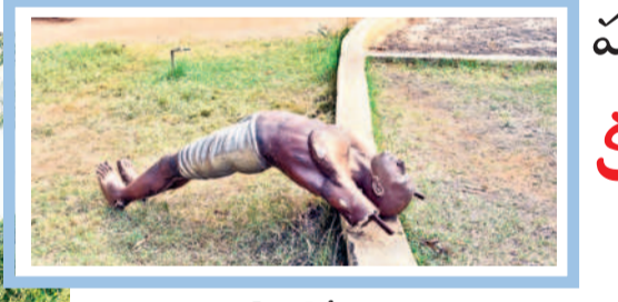
హనుమకొండ పబ్లిక్ గార్డెన్లో ధ్వంసమైన యోగ ముద్ర విగ్రహాలు