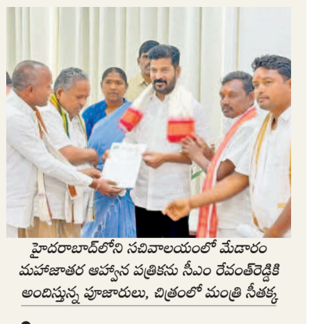
హైదరాబాద్ లోని నవీబాలయంలో మేదారం మహాజాతర అహహన పత్రికను సీఎం రేపంబెడ్డికి అందిస్తున్న పూజారులు, బి.అతల్ మంత్రి సీతక్క

● అక్రమ నిర్మాణాల కూల్చివేత కలిమాబాద్, జనవరి 27: నగరంలోని ఖిలావరంగల్ మండల పరిధి ప్రభుత్వ భూమి సర్వేనంబర్ 140లో అక్రమ నిర్మాణాలను అధికారులు శనివారం కూల్చేశారు. గతంలో కొందరు ఫిర్యాదు చేయగా రెవెన్యూ, వరంగల్ మహానగర పాలక సంస్థ, పోలీస్ అధికారులు స్పందించారు. గతంలో ఈ సర్వేనంబర్లో దాదాపు ఎకరం భూమిని బిఆర్ఎస్ పార్టీకి కేటాయించారు. దీంతో మే 2023లో పార్టీ జిల్లా కార్యాలయ నిర్మాణం కోసం భూమిపూజా చేశారు. ఈ స్థలానికి హద్దులను ఏర్పాటు చేయాలని బిఆర్ఎస్ నాయకులు ఇటీవలే అధికారులకు ఫిర్యాదు చేశారు. దీంతో అధికారులు అక్రమ నిర్మాణాలను కూల్చివేయడం తోపాటు ఆ స్థలంలో ఫ్లోర్ ఏర్పాటు చేశారు.