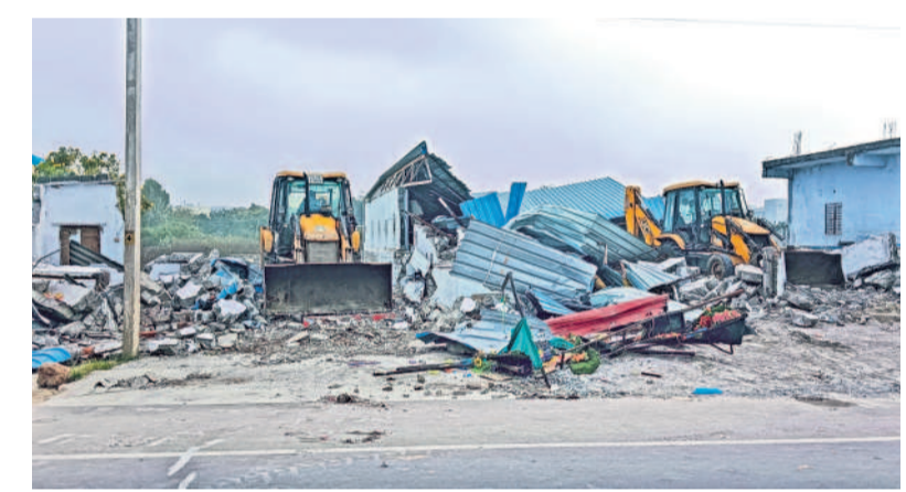
అక్రమ నిర్మాణాలను కూల్చివేస్తున్న సిబ్బంది