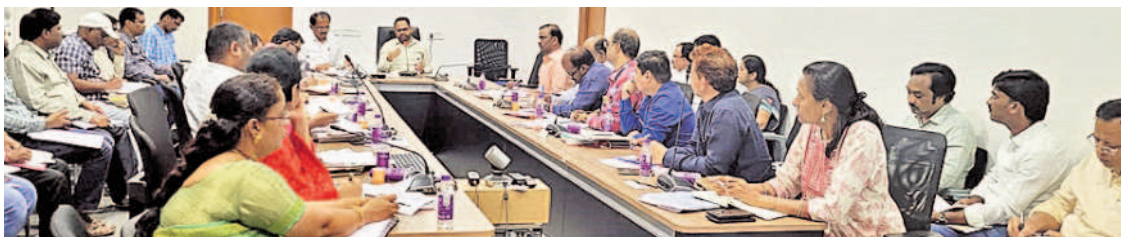
తహసీల్దార్ల సమావేశంలో మాట్లాడుతున్న కలెక్టర్ శశాంక

రంగారెడ్డి కలెక్టర్ శశాంక..రాజకీయపార్టీల ప్రతినిధులు, తహసీల్దార్లతో కలెక్టర్ టోలో సమావేశం