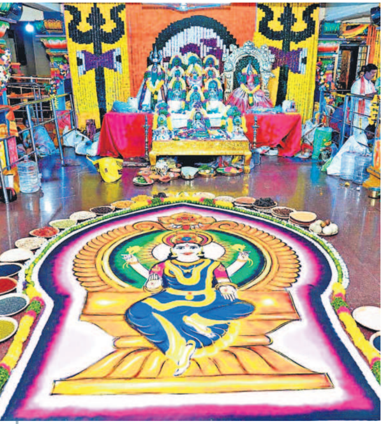
బల్లంపేట ఎల్లమ్మ దేవాలయ ఆవరణలో రంగులతో తీర్చిదిద్దిన అమ్మవారి చిత్రం