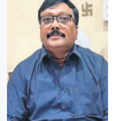
- రమణ్, జోటీనీ, హైదరాబాద్

వాహనదారులకు పారదర్శకమైన సేవలు అందించడమే మూ లక్ష్యం. బ్యాంకు రుణాలపై వాహనాలు కొనుగోలు చేసిన వారు రుణ ప్రక్రియ పూర్తయ్యాక ఆర్‌సీ కోసం ఇబ్బందులు ఎదుర్కొంటున్నారు. అలాంటి ఇబ్బందులు లేకుండా నేరుగా ఆర్టీఎ నుంచి వారి మొబైల్‌కు లింక్ చేరుతుంది. ఆ లింక్ ను ఓపెన్ చేసి వివరాలు అవలోడ్ చేస్తే సరిపోతుంది. ఫోన్లో ఆర్‌సీ ఇంటికి చేరుతుంది. ఇప్పటికే టీ యాప్ ఫోలియో వాహనదారులు కార్యాలయానికి రాకుండానే సేవలు పొందుతున్నారు.