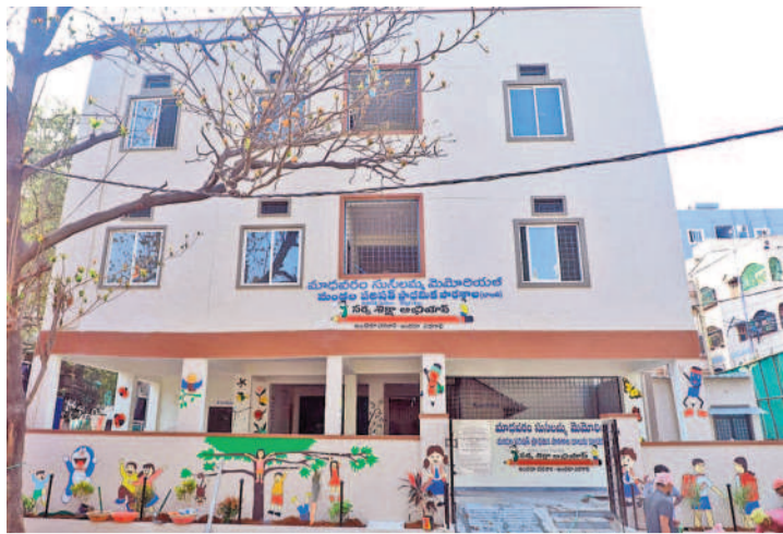
కూకట్‌పల్లిలో సోమవారం ప్రారంభించనున్న మాధవరం సుశీలమ్మ మెమోరియల్ ప్రభుత్వ ప్రాథమిక పాఠశాల