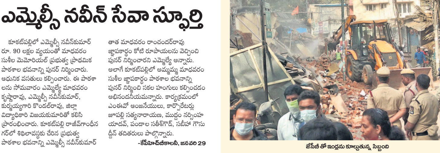
జీవితో ఇండ్లను కూల్చుతున్న సిబ్బంది

ఎన్నో చారిత్రక పోరాటాలు, వైభవానికి ప్రతీకగా నిలిచిన ఉస్మానియా యూనివర్సిటీ ఆర్ట్స్ కళాశాలకు రూ. 12 కోట్ల వ్యయంతో డైనేమిక్ సౌండ్ అండ్ లైటింగ్ సిస్టం ఏర్పాటు చేశారు. గ్రాఫిట్ ద్వారా వచ్చే చరిత్ర, ప్రస్తుతం మునుగులు, ఉద్యమ మల్లలు, ఇక్కడ చదివిన ప్రముఖుల వివరాలతో వందేంద్ర యూనివర్సిటీ చరిత్రను డాక్యుమెంటరీగా రూపొందించి.. ప్రదర్శించారు. - ఉస్మానియా యూనివర్సిటీ, జనవరి 29